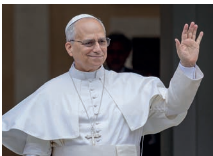
Leó pápa egy éve