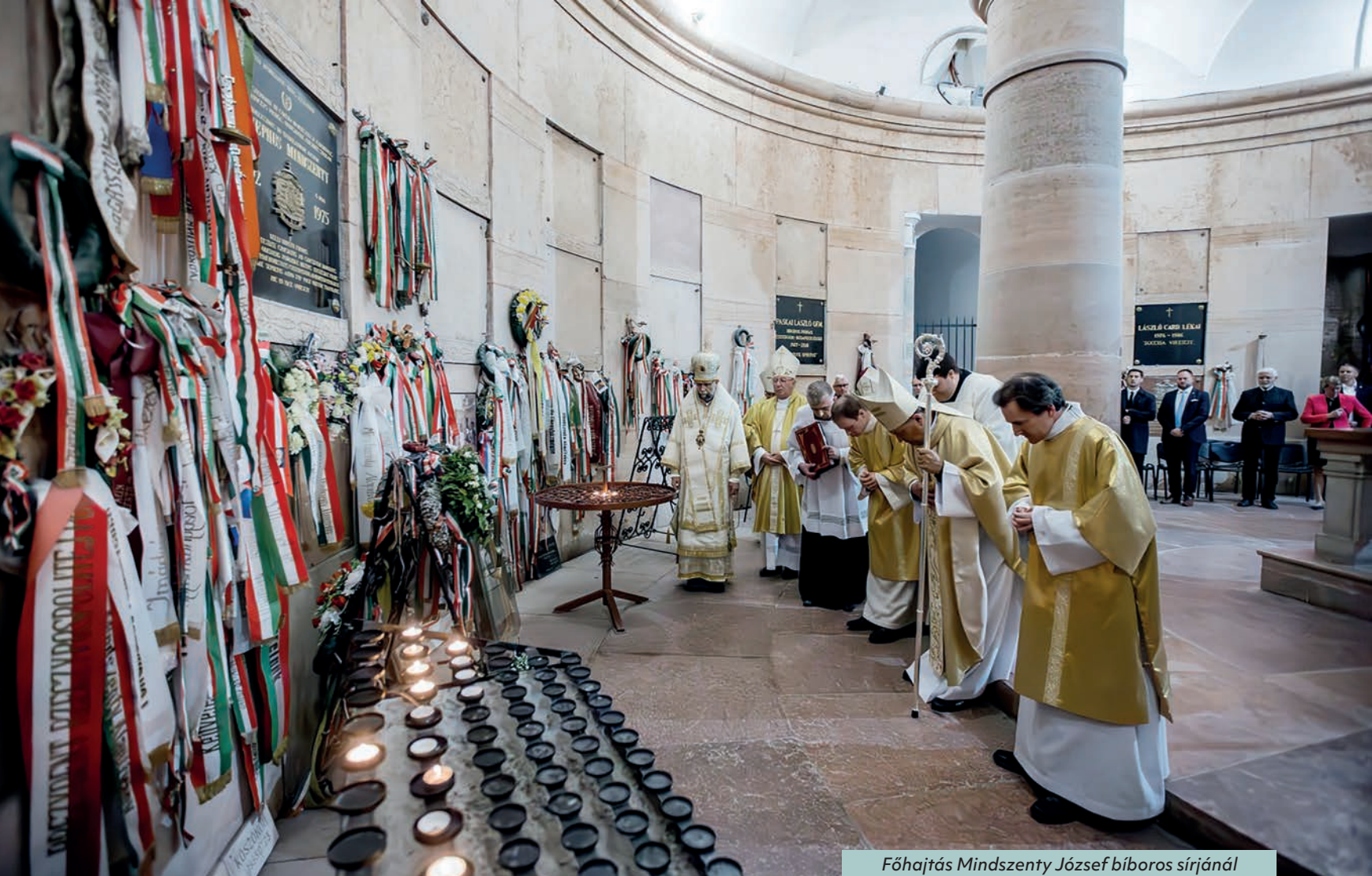
Főhajátás Mindszenty József bíboros sírjánál