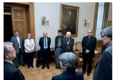
Egyházi vezetők a Magyar Tudományos Akadémián