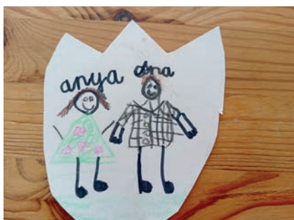
Kölcsönteső a nagycsaládban 13–14. oldal