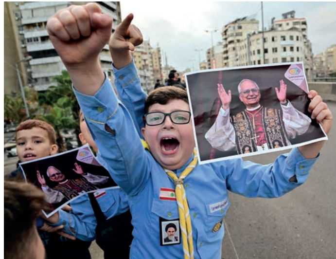
Giuseppe Cacace (AFP) fotója, amelyet a pápa magánál tart

kérdéssel szemben. A Szentszék már beszélt a német püspökökkel. A Szentszék egyértelművé tette, hogy nem értünk egyet a párok, jelen esetben az Ön által említett azonos nemű párok vagy a szabálytalan helyzetben élő párok formális megáldásával, azon túl, amit Ferenc pápa