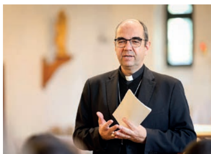
A választások után – Székely János püspök gondolatai 5. oldal