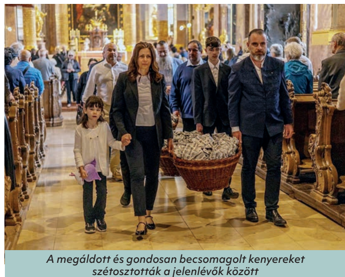
A megáldott és gondosan becsomagolt kenyeret szétosztották a jelenlévők között

A kenyérmegáldást kísérő rövid szertartás keretében Böcskei Győző székesegyházi plébános felolvasta János evangéliumából a kenyérszaporításról szóló részt (Jn 6,1–15) az élet kenyérééről. A könyörgés után Veres András püspök megáldotta „a próféta kenyerét”, melyet a liturgia végén szétosztottak a jelenlévők között.