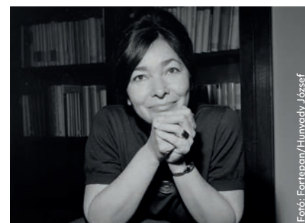
Köszöntjük az édesanyákat! – Szabó Magda írásával 21. oldal