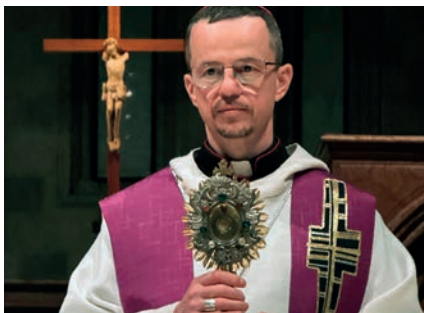
Szent Benedek ereklyéjével imádkoznak Ukrajnában 3. oldal