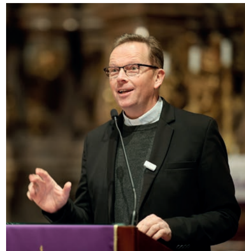
Fábry Kornél püspök

Forrai Tamás előadásában arról beszélt, hogy a szinodális gondolkodás és a lelki megkülönböztetés nemcsak az Egyház nagy döntéseiben,