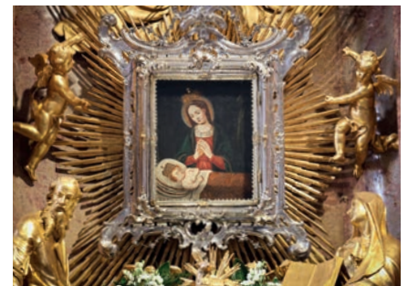
Könnyező Szűzanya-búcsú Győrben 16-17. oldal