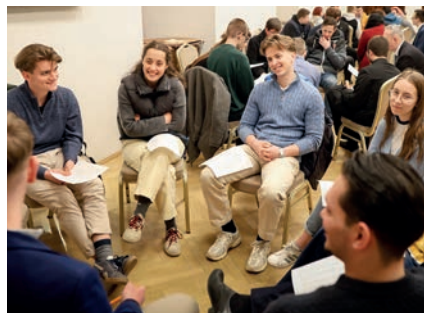
Fiatalok színódusa Budapesten 8-10. oldal