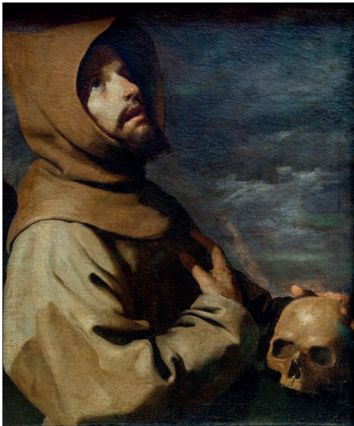
Francisco de Zurbarán: Szent Ferenc extázisa

– Így van. Magának a Naphimnusznak is ez az ószövetségi szöveg helye az egyik inspirálója. A Weöres-versnek már a címében („ Ima ”) is megjelenik az imádság és az Istennel való dialógus beszédhelyzete. A lírai én rögtön meg is szólítja Istent: „Köszön-telek a folyók zúgásával...,” „Köszön-telek a szívárvánnyal, az