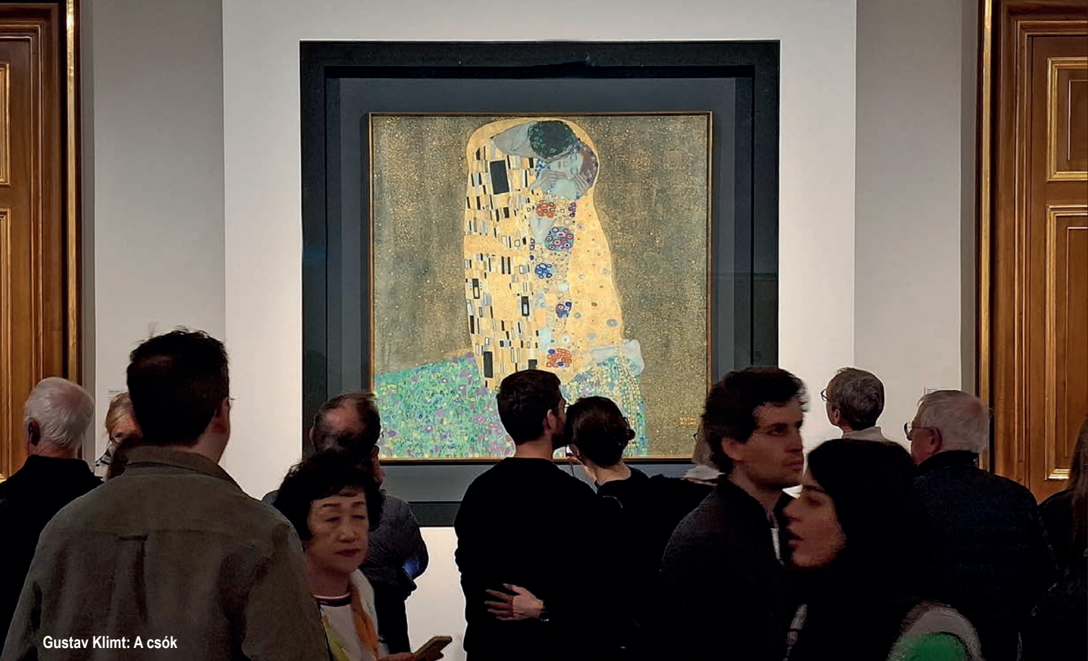
Gustav Klimt: A csók