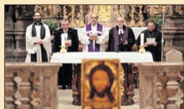
Ökumenikus imádság Ukrajna békéjéért 3. oldal