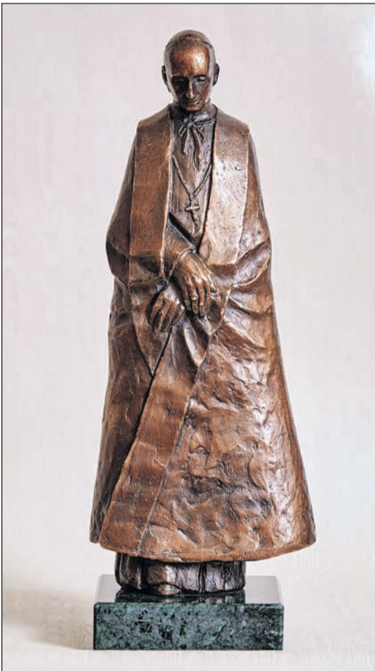
Az ausztriai kegyhelyen felállítandó életnagyságú Mindszenty-szobor kicsinyített mása

Julian atya megrendelésére. Az alkotó, Schmidt Béla egészen páratlan portrét festett, egy valódi Mindszenty-ikont. Fecske Orsolyának a bíborosról készült nagyszerű portrét is ki kell emelnünk. Különleges élmény egymás mellé állítani ezt a két képet: Schmidt Béla munkáján ott van Mindszenty atya teljes lelki mélysége. Fecske Orsolya festménye pedig egy érzékeny női látásmódból fakadó, emberközeli alkotás, amelyen keresztül belenézhetünk a bíboros szemébe. Feltétlenül említésre méltó Alberto Ceppinek a budapesti Szent István-bazilika kincstárában látható térplasztikája is, a XX. század keresztjeire feszített Mindszenty című mű. Ez Krisztusba öltözve ábrázolja Mindszentyt, aki a sírfelirata szerint a legműségesebb pásztor . A keret, amelybe az olasz szobrászművész a bíboros alakját ágyazta, egészen magával ragadó, s megjeleníti a teljes életművet és élet-szentséget. A Mindszentyről