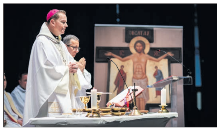
Fábray Kornél: A boldogság a hálás lelkület gyümölcse