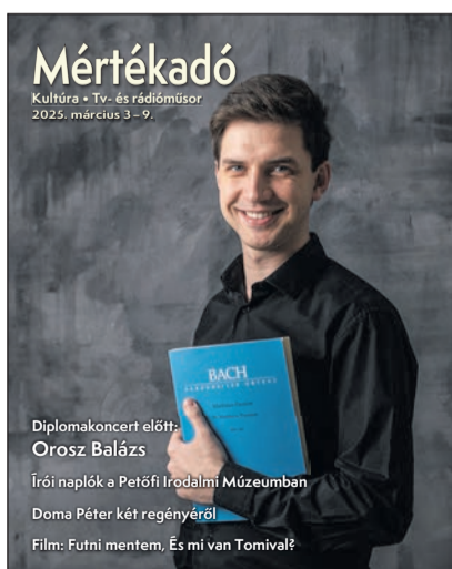
Mértékadó Kultúra • Tv- és rádióműsor 2025. március 3–9.