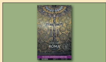
Török Csaba Róma című kötetéről Esztergomban 12. oldal