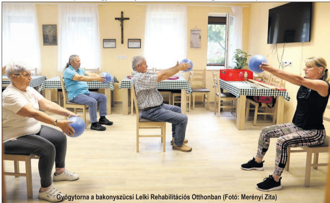
Gyógytorna a bakonyzsücsi Lelki Rehabilitációs Otthonban

Vámosy Erzsébet