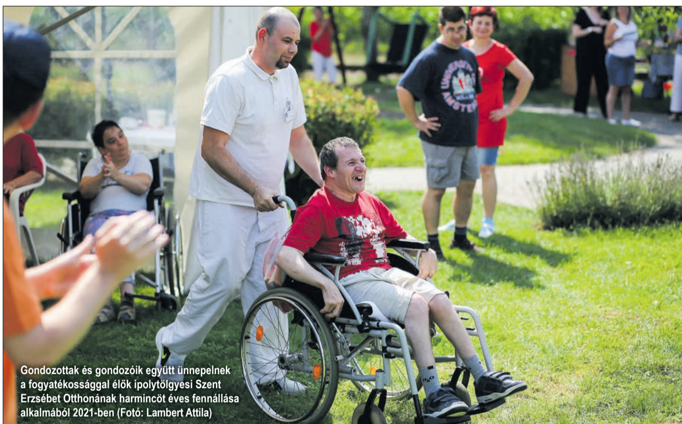
Gondozottak és gondozók együtt ünnepelnek a fogyatékossgal élők ipolytölgyesi Szent Erzsébet Otthonának harmincöt éves fennállása alkalmából 2021-ben