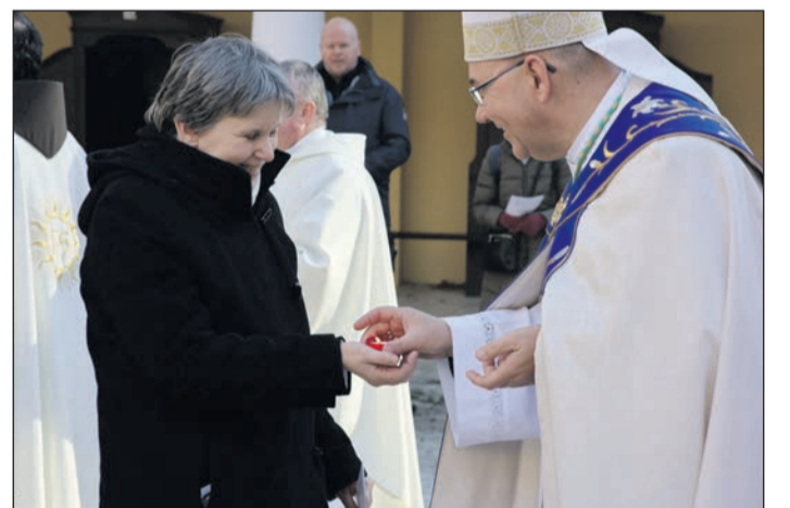
Váci Egyházmegye (Mátraverebély-Szentkút)