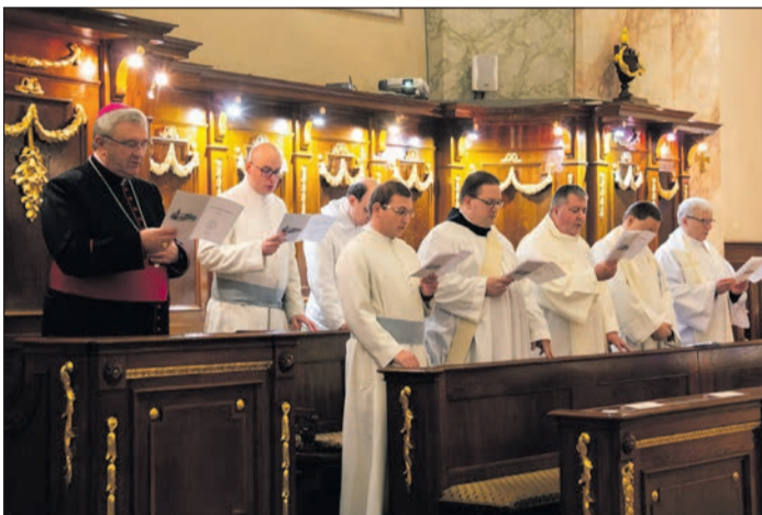
Győri Egyházmegye (Csorna)