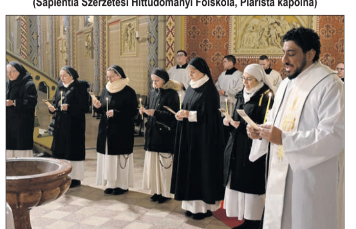
Szombathelyi Egyházmegye (Kőszeg)