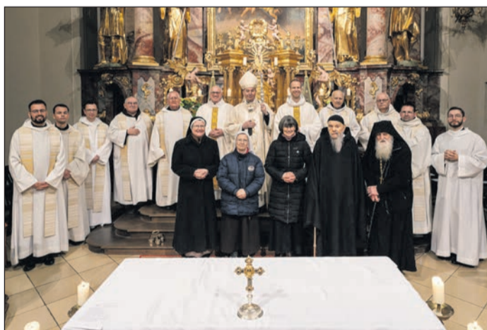
Veszprémi Főegyházmegye (Tihany)