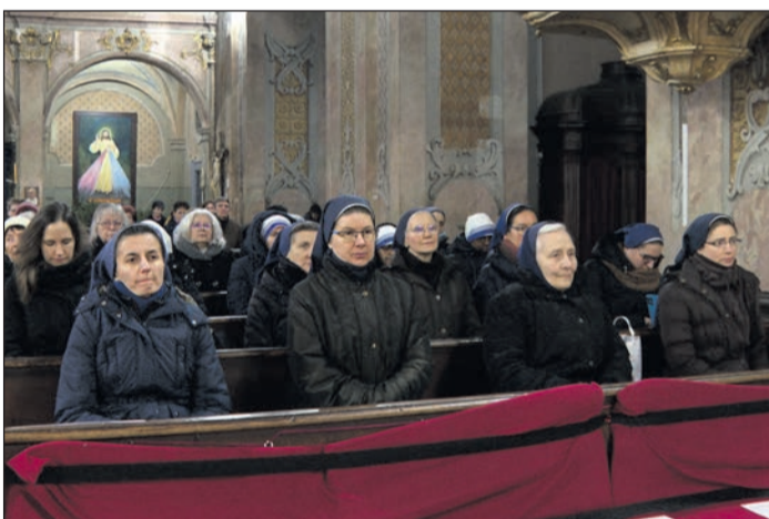
Egri Főegyházmegye (Szent Bernát ciszterci templom, Eger)