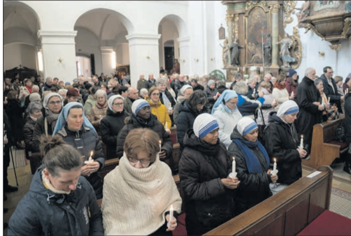
Kaposvári Egyházmegye (Andocs)