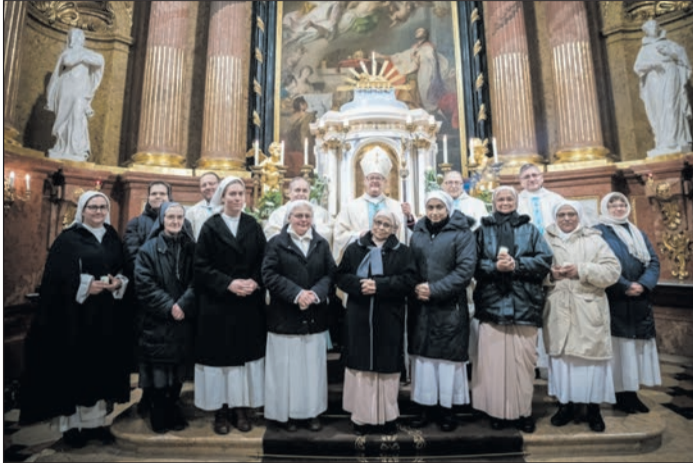
Székesfehérvári Egyházmegye (Szent István király székesegyház)

Gyertyaszentelő Boldogasszony ünnepén (február 2.), a megszentelt élet napján az ország számos templomában gyűltek össze ünnepelni a szerzetesek, több helyütt az egyházmegyék főpásztorainak részvételével. A magyarországi rendek képviselői február 1-jén Budapesten, a Sapientia Szerzetesi Hittudományi Főiskola épületében Michael W. Banach érsekkel, apostoli nunciussal ünnepeltek előesti szentmisét. Képes összeállításunk a teljesség igénye nélkül mutatja be a megszentelt élet ünneplését egyházmegyéinkben.