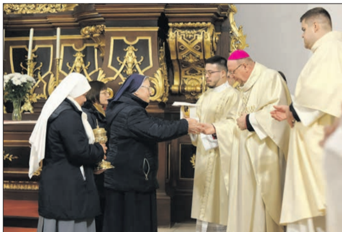
Debrecen-Nyíregyházi Egyházmegye (Szent Anna-székesegyház)