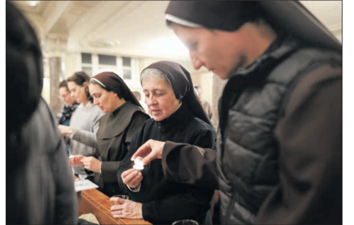
Esztergom-Budapesti Főegyházmegye (Sapientia Szerzetesi Hittudományi Főiskola, Piarista kápolna)