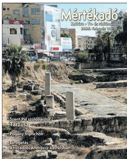
Szent Pál szülővárosa: Tarszus Pogány triptichon Látogatás a fészadobi Andrassy-kastélyban