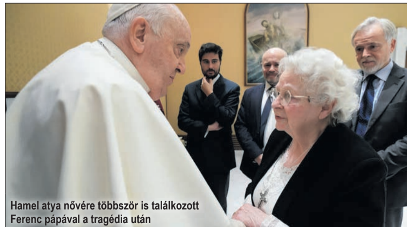
Hamel atya nővére többször is találkozott Ferenc pápával a tragédia után

A meggyilkolt francia Hamel atya nővérének tanúságtétele a kiengesztelődésről