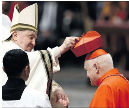
Német László SVD, Belgrád-Szendró érseke megkapja Ferenc pápától a bíborosi kalapot

1958. november 1-jén született Ivate prefektúrájában (Tóhoku tartomány). Japánban végezte tanulmányait. Örökfogadalmát az Isteni Ige Társaságában (verbiták) 1985 márciusában tette le, 1986. márciusban pedig pap-pá szentelték. Tanulmányait a Melbourne-i (Ausztrália) Spiritual Institute of Sacred Heart intézetben fejezte be. 1986 és 1992 között Ghánában, az Accrai és a Koforiduai Egyházmegyékben volt misszionárius. 1993-tól 1994-ig Japánban a verbita rend jelöltjeinek alprefektusa, valamint a társaság hivatásokért felelős igazgatója. 1994 és 1999 között a verbiták tartományi tanácsosa. 1994-től oktató a Nanzani Egyetemen és a Japán Püspöki Konferencia Nemzetközi Segélyezési Bizottságának tagja. 1996-tól a verbiták Igazságosság, Béke és a Teremtés Megőrzése Irodájának koordinátora az ázsiai és a csendes-óceáni térségben. 1998-tól a Caritas Japan tagja és a japán püspökök képviselője különböző nemzetközi konferenciákon, találkozókon. 1999-től a verbiták tartományfőnöke Japánban (2002-ben másodsorra is megválasztották),