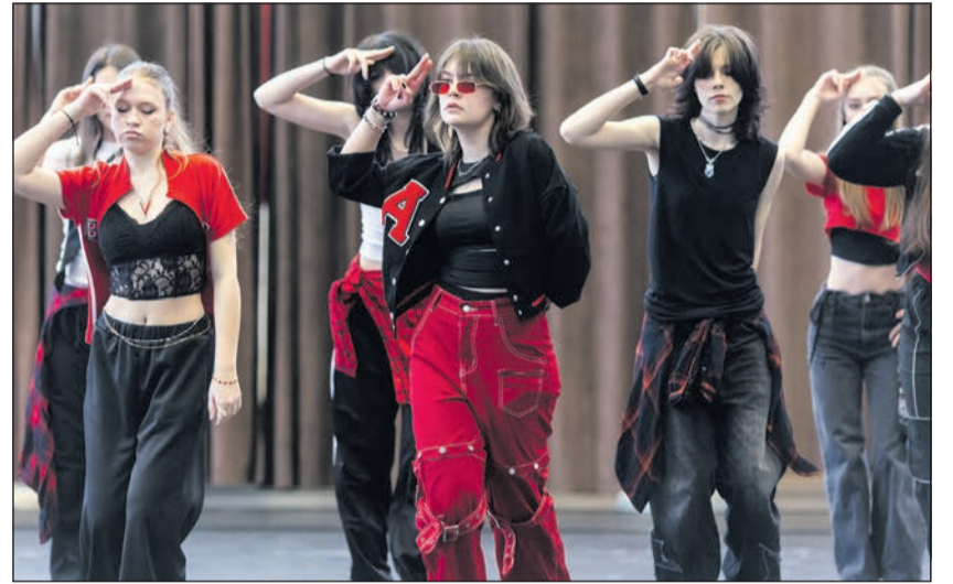
A zenés, táncos gálán közel nyolcvan fellépő adott műsort

Az ünnepelés az „Álom, ígéret, jövő” mottó jegyében a hagyományos zenés, táncos, gálával folytatódott: benne néptánc, akrobatikus és modern tánc, szavaltat, mazsorett, ének, hangszeres zene. Közel nyolcvan fellépő adott színvonalas műsort. Végül