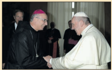
Pápai magánkihallgatás a pannonhalmi főapát