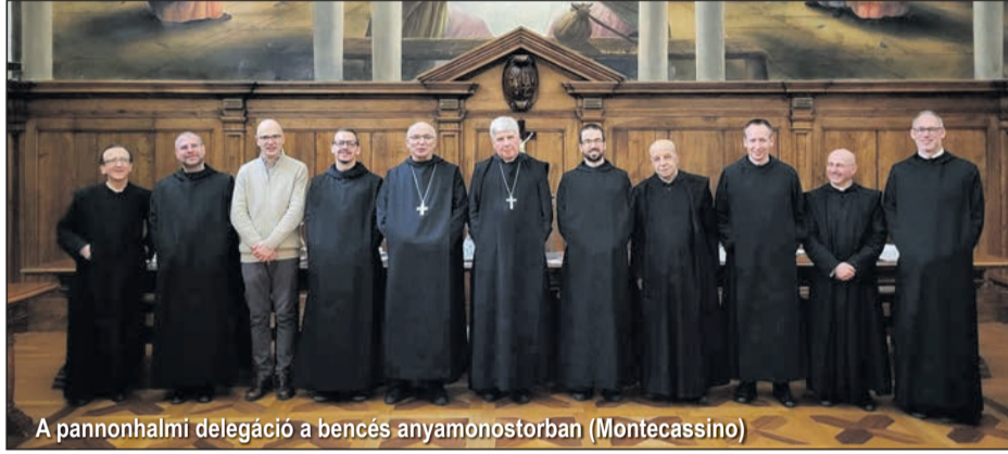
A pannonhalmi delegáció a bencés anyamonostorban (Montecassino)

A delegáció a pannonhalmi Szent Márton-bazilika 800. évfordulójára készült Pannonhalmi Bencés Főapátság emlékére arany próbaveretét adta át