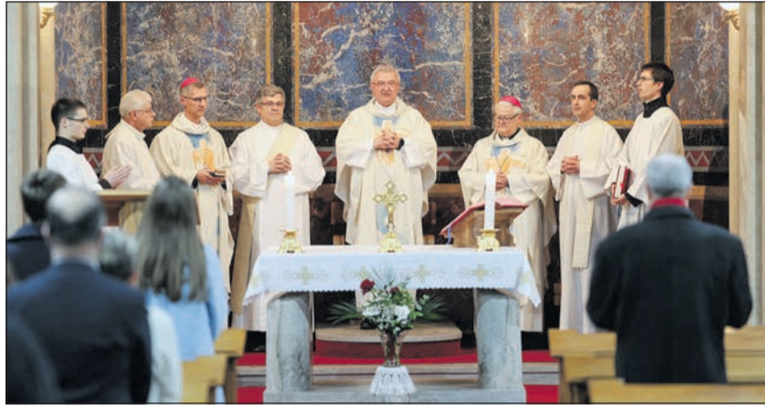
A Szalézi Szent Ferenc-ösztöndíj átadását idén is szentmise előzte meg

kolás kora óta – természetes részét képezték életének. Diákévei alatt aktív vendégszerzője volt többek között a munkácsi egyházmegye Új Hajtás havilapjának, majd az egyetemi diákszervezet sajtóreferense lett.