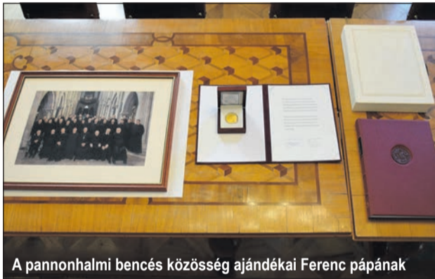
A pannonhalmi bencés közösség ajándékai Ferenc pápának

A pápai audienciát megelőző napon a delegáció ellátogatott Montecassinóba, a bencés anyamonostorba, amellyel 1212-ben kötött imaszövetséget Pannonhalmra. Eszerint a két közösség minden évben január 25-én imádkozik egymásért. Az imaszövetség évfordulójának másnapján, 2025. január 26-án cassinói szerzetesek és a pannonhalmi delegáció tagjai a bencés rend alapító atyjának, Szent Benedeknek a sírjánál mondtak imát a két monostorért.