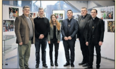
Kazincbarcikán nyílt kiállítás a Magyar Kurír fotóiból