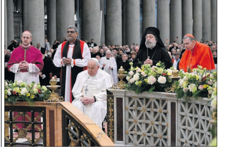
(Folytatás az 1. oldalról)

A Nikaiai Zsinat azon fáradozott, hogy egy nagyon nehéz időszakban megőrizze az Egyház egységét, és a zsinati atyák egyhangúlag elfogadták azt a hitvallást, amelyet sok keresztény még ma is minden vasárnap elmond az eucharishtiában. Ez egy közös hitvallás, mely túlmutat az összes megosztottságon, melyek az évszázadok során megsebeztek Krisztus testét. A Nikaiai Zsinat évfordulója tehát kegyelmi évet jelent; kedvező lehetőség az összes keresztény számára is, akik ugyanazt a hitvallást mondják és ugyanabban az Istenben hisznek: fedezzük fel újra a hit közös gyökereit, őrizzük meg az egységet! Haladjunk mindig előre! A felé az egység felé, amelyet mindannyian meg akarunk találni. Arra vágyunk, hogy az egység megvalósuljon. Emlékezzetek-e arra, amit a nagy ortodox teológus, Ioannis Zizioulas mondott: »Tudom, milyen dátummal valósul meg a teljes egység: az utolsó ítélet utáni napon.« De addig is együtt kell haladnunk előre, együtt kell dolgoznunk, együtt kell imádkoznunk, együtt kell szeretnünk. És ez nagyon jó!