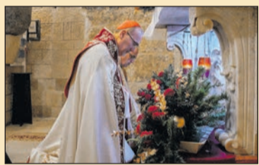
A Szentföldön is megnyitották a jubileumi szentévet 7. oldal