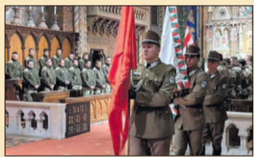
A kiengesztelődésről a doni áttörés évfordulóján 11. oldal