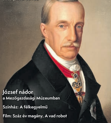
József nádor a Mezőgazdasági Múzeumban Színház: A félkegyelmű Film: Száz év magány, A vad robot

Kultúra • Tv- és rádióműsor 2025. január 20.–26.