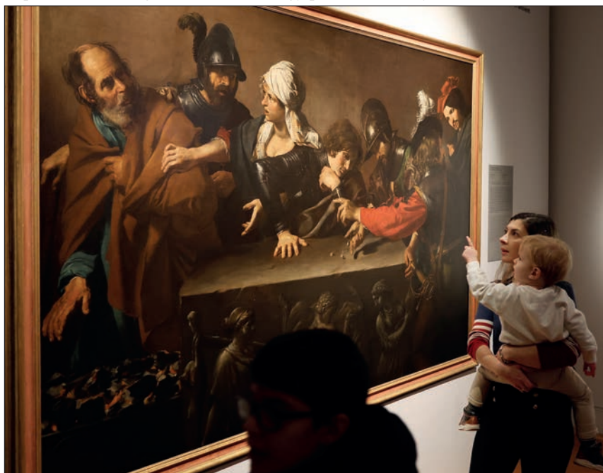
Valentin de Boulogne: Péter apostol árulása

Ezt a tudatos folyamatot hivatott erősíteni az a november 16-án nyílt tárlat is, amelyet Michelangelo Merisi da Caravagiónak és követőinek szentelt a Temesvári Nemzeti Művészeti Múzeum. A kiállítás azt mutatja be, hogy miként jelentkezik a modernitás az európai festészetben a Caravaggio nevéhez fűződő realista ábrázolásmód, illetve a mesternek a fény és az árnyék kontrasztján alapuló sajátos fénykezelése nyomán. Rövid élete során Caravaggio nem alapított iskolát, tanítványokat sem hagyott hátra. Hatása azonban meghatározó volt, sokan vitték tovább egyedi művészetének egyes sajátosságait. Roberto Longhi olasz művészettörténész éppen ennek a témának szentelte munkássága lényegi részét. Az elmúlt évszázad egyik vezető olasz műkritikusa nemcsak szakértelemmel magyarázta Caravaggio életművét és azt, hogy az milyen hatással volt más alkotókra, hanem fáradságos munkával felkutatta és meg is vásárolta ezeket az alkotásokat. A firenzei székhelyű Longhi-gyűjteményből most negyvenhárom kép látható a temesvári tárlaton, harminchárom művésztől. A kiállított művek ékköve pedig Caravaggio saját