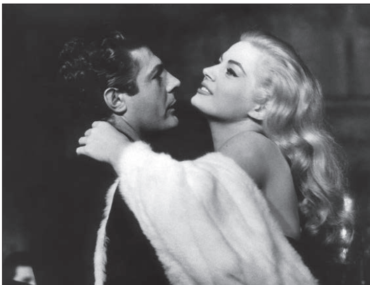
Az édes élet

Az édes élet (1960) Marcello Rubini (Marcello Mastroianni), egy ifjúként írói reményeket dédelgető bulváriporter lelki és szellemi lezüllesztését mutatja be. Ebben a világban már nincsenek biztos fogódzók. Marcello barátja, a látszólag boldog házasságban élő Steiner megöli két gyermekét, mert képtelen szembenézni önnön démonaival. A kereszténység is már külső dísz csupán, nem pedig az életet jobbra tevő lelki-szellemi erő. Marcellót a tizenhat éves Paola az umbriai templomban látható angyalokra emlékezteti. A film végén, a totális lelki és szellemi szétesettség állapotában azonban már nem ismeri fel. Pedig Paola az angyal, aki felvillantja a lezüllesztett Marcello előtt egy értelmesebb élet lehetőségét. Rajta múlik, hogy él-e a kegyelemmel. Az őrangyal