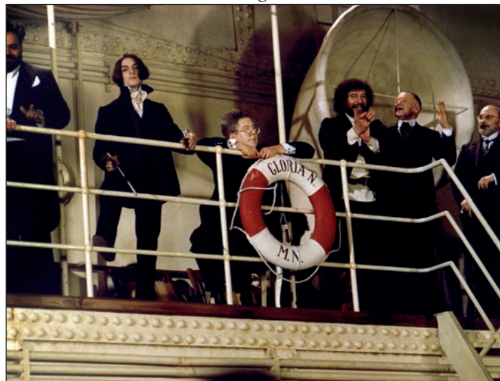
És a hajó megy

szeretném megkérdezni, hogyha már idepottyantam, mi dolgom ezen a világon?” Ez az a hívóket és nem hívóket minden korban egyformán kínzó kérdés, amelyre senki nem tud válaszolni ebben a történetben. Nincsenek valóban hiteles személyek, akik reményt, vigaszt adnának az összezavarodott embereknek. A regény és a belőle készült film is azt sugallja, hogy a kaotikus, zűrzavaros világban a látszólagos bolondok – Salvini, a mellészegődött Gonella és a zene démoni hatalmától megrettent, a világból kivonult, hajléktalanná vált zenész – őrzik az értékeket, de szakadéknyi távolság választja el őket az úgynevezett normálisoktól. Joggal mondja Salvini: „Minket, értelmesekeket nem ért meg senki.” Az igazi valóság ugyanis a természetfölöttiben mutatkozik meg, annak feltárásához pedig érző lélekre van szükség, arra, hogy látva lássunk és hallva halljunk. Még akkor is, ha nem értünk mindent, ahogyan azt a film végén a hold közli az emiatt panaszkodó Salvinivel: „Nem kell értened. Az lenne a baj, ha megértenéd.” Salvini azonban reménykedik: „Én mégis azt hiszem, ha egy kicsit nagyobb csend lenne, ha mindnyájan csendesebbek lennénk, talán megérthetnénk valamit.” A valódi