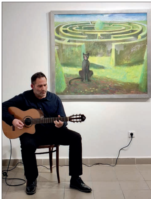
Hangulatos zene a megnyitón, háttérben a Labirintus című pasztellkép

Amikor az ember színeket visz föl a vászonra, s ezzel egy látható formát idéz vissza, akkor tulajdonképpen nem festéket és színeket használ, hanem fényt fest, és ezen túl még hangokat, illatokat, hőmérsékletet is. Ez a festészet lényege: túlemelkedni az anyagon. Bráda Tibor képein ékes bizonyítékát láthatjuk ennek. Mi olyan korban élünk, amikor megyünk az autópályán, bekapcsoljuk a rádiót, fölhúzzuk