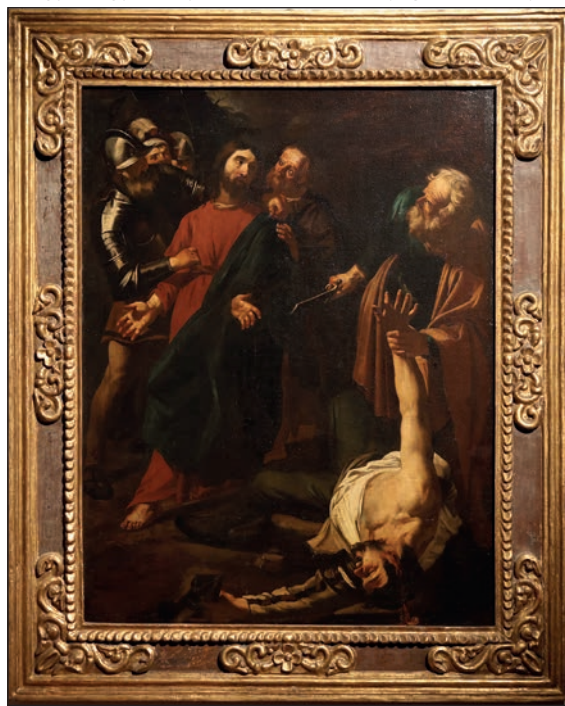
Dirck van Baburen: Jézus elfogása

Savoyai Jenő, akinek a budai Várban álló szobra advent idején a fények játékában töltötte estét, nem találkozhatott a