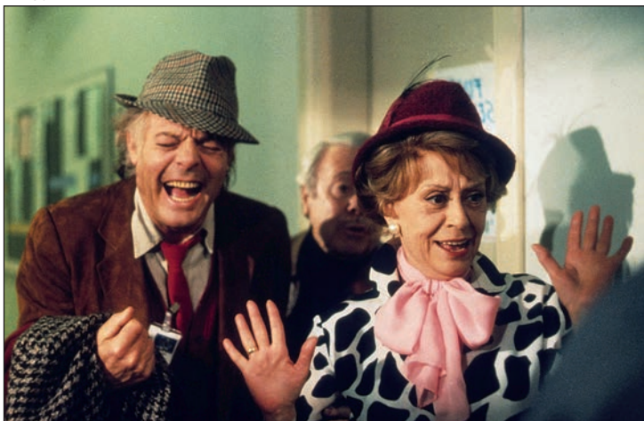
Ginger és Fred

A hold hangjai (1990) Fellini utolsó filmje. Ermanno Cavazzoni 1987-ben írt – később magyarul is megjelent – A holdkórosok epusza című regényét vitte vászonra a rendező. A színhely egy olasz kisváros. A főhős, a költő Salvini úgy érzi, a hold duruzsol neki, s ezeket a hangokat követve vándorol, különös alakokkal találkozva. A világot jellemző felszínesség, sekélyesség nyilvánul meg abban, amikor a Michelizzi fivérek foglyul ejtik a holdat, amely „évezredek óta kémlen minket, mindig is kémlt”. A hold az emberek állandóan szemmel tartó, ellenőrző hatalmat is jelenti, amelyet most elfognak, és igyekeznek félreállítani. Ez csupán egy a bulvárlapok és általában a média által naponta tálalt megannyi szenzációs esemény közül. A kisváros főterén, tévériporterek társaságában és hatalmas, zibongó tömeg jelenlétében összeül a legújabb kori varázsfórum, a mindenre megoldást találni hivatott kerekasztal, amelyen világi és egyházi vezetők vesznek részt. Az emberi ésszel felfoghatatlan esemény értékelői azonban a tanácskozáson nem jutnak túl a közhelyek szajkózásán. Az Egyházat képviselő bíboros, amikor a riporter arról faggatja, hogy mit kérdezne a holdtól, ha az tudna beszélni, azzal intézi