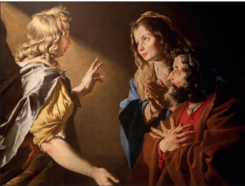
Matthias Stomer: Sámson születésének hírüladása

kézjegyével ellátott első alkotása, a Fiú, akit megharapott egy gyík . A festmény 1595–1600 körül keletkezett.