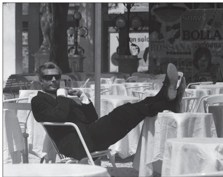
8 és 1/2