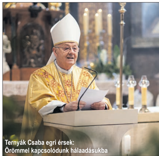
Ternyák Csaba egri érsek: Örömmel kapcsolódunk hálaadásukba