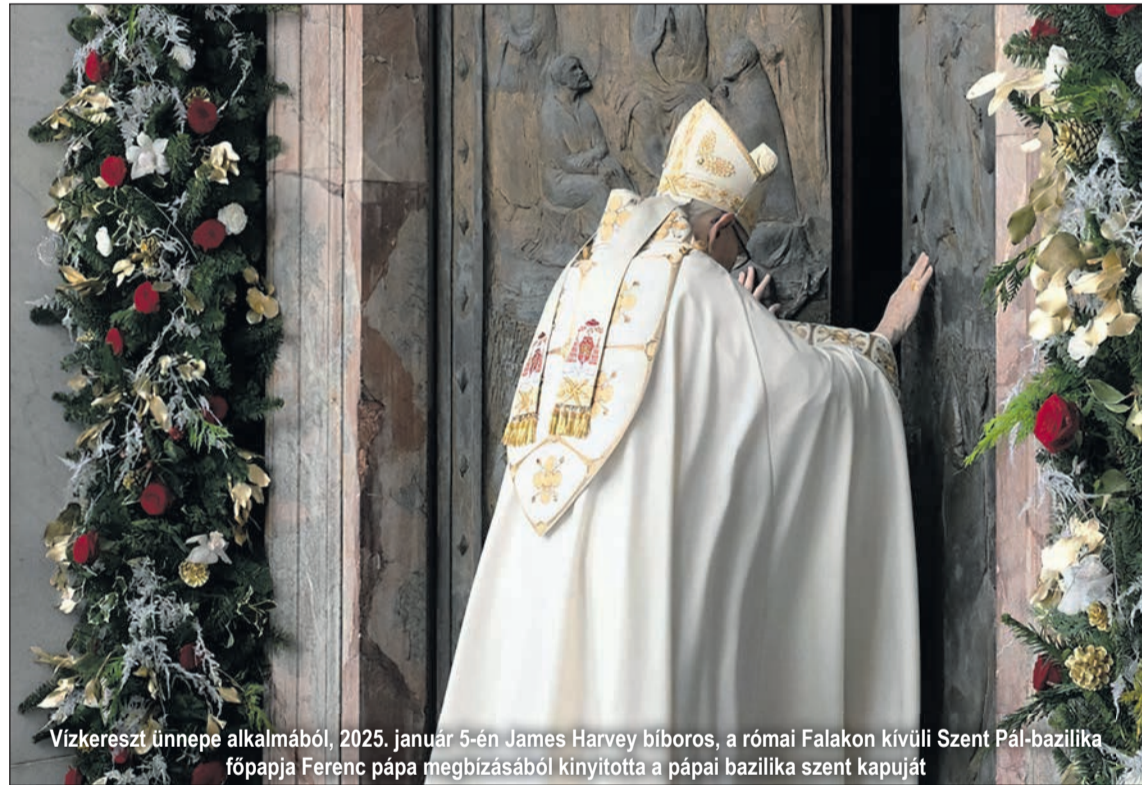
Vízkereszt ünnepe alkalmából, 2025. január 5-én James Harvey bíboros, a római Falakon kívüli Szent Pál-bazilika főpapja Ferenc pápa megbízásából kinyitotta a pápai bazilika szent kapuját

kapukat, adott esetben akár többet is, annak megfelelően, hogy mely szentévek bírnak különös jelentőséggel az adott helyi egyház életében. Ennek a kezdeményezésnek eredményeképpen Esztergom városa is otthont adott egy szent kapunak: a bazilika nyugati, úgynevezett királyi kapuját díszítették fel s nyitották meg ünnepélyesen. Maga a pápa még egy korábban példa nélküli döntést hozott: a hivatalos kezdést, december 8-át (a II. Vatikáni Zsinat lezárásának napját) megelőzően a Közép-Afrikai Köztársaságban szent kaput nyitott a bangui székesegyházban (november 29.). Ezzel az irgalmasság gondolatát, evangéliumi üzenetét szerette volna közelebb hozni ehhez a polgárháborútól sokat szenvedő országhoz, de az egész világhoz is.