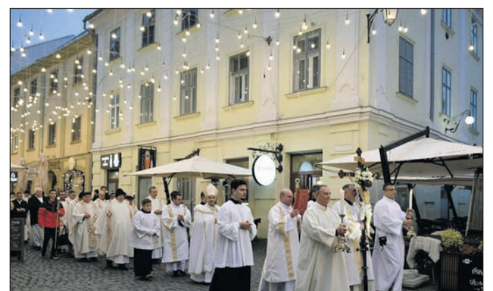
Temesvári Római Katolikus Egyházmegye