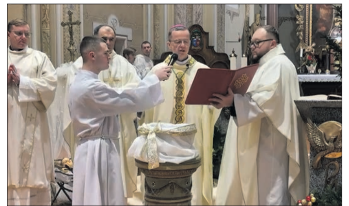
Munkácsi Római Katolikus Egyházmegye