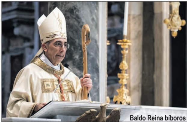
Baldo Reina bíboros

A lateráni Keresztelő Szent János-főszékesegyházban, a legszentebb Údvözlő bazilikájában 2024. december 29-én, a Szent Család vasárnapján Baldo Reina bíboros a Római Főegyházmegye általános helynökeként Ferenc pápa megbízásából ünnepélyesen megnyitotta a pápai bazilika szent kapuját, majd szentmisét mutatott be.