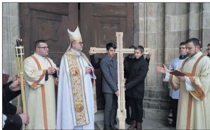
Gyulafehérvári Római Katolikus Főegyházmegye

A szentévet megnyitó egyházmegyei szertartások a legtöbb helyen a következő liturgikus rendben zajlottak: az adott egyházmegye főpásztorának vezetésével a papság és a hívek ünnepélyes körmenetben vonultak a székesegyházhoz, ahol sor került a szent kapu megnyitására, ezután bűnbánati liturgiát tartottak, s következett a vízszentelés szertartása, majd a helyi hívő közösség szentmisét ünnepelt. Képes összeállításunk a teljesség igénye nélkül mutatja meg az egyházi ünnepet a külhoni egyházmegyékben.