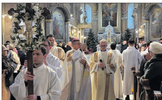
Szatmári Római Katolikus Egyházmegye