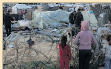
A gyerekek helyzete a világban UNICEF-jelentés a 8. oldalon