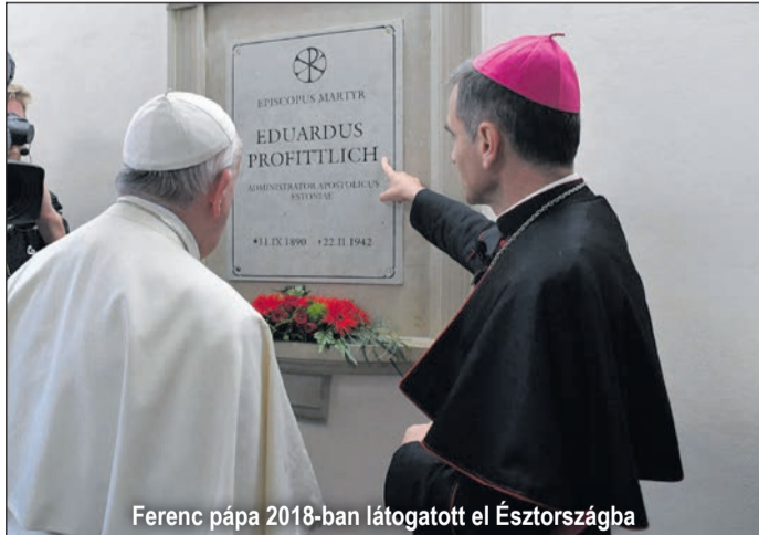
Ferenc pápa 2018-ban látogatott el Észtországba

Eduard Gottlieb Profittlich, aki 1890-ben a Német Birodalom déli részén fekvő Birresdorfbán egy parasztcsaládban született, 23 évesen lépett be a Jézus Társasá-