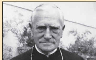
Tiszteletreméltó Márton Áron püspök