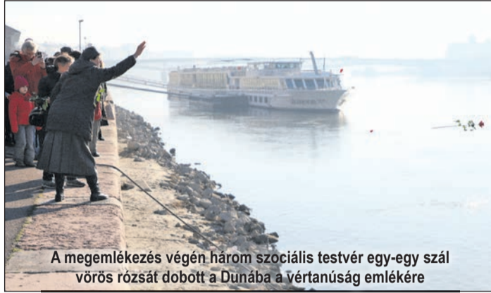
A megemlékezés végén három szociális testvér egy-egy szál vörös rózsát dobott a Dunába a vértanúság emlékére