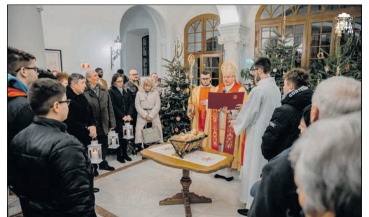
Nagyvárad Római Katolikus Egyházmegye