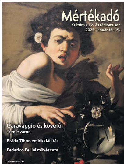
Mértékadó Kultúra • Tv- és rádióműsor 2025. január 13-19.

Caravaggio és követői Temesváron Bráda Tibor-emlékkiállítás Federico Fellini művészete