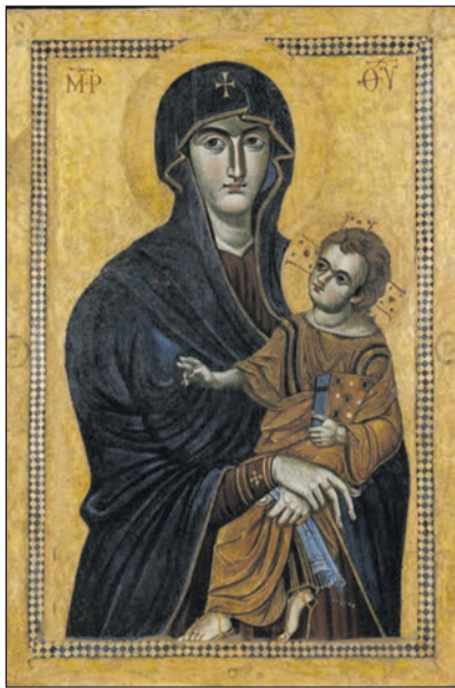
A Salus Populi Romani (A római nép megmentője) kegykép