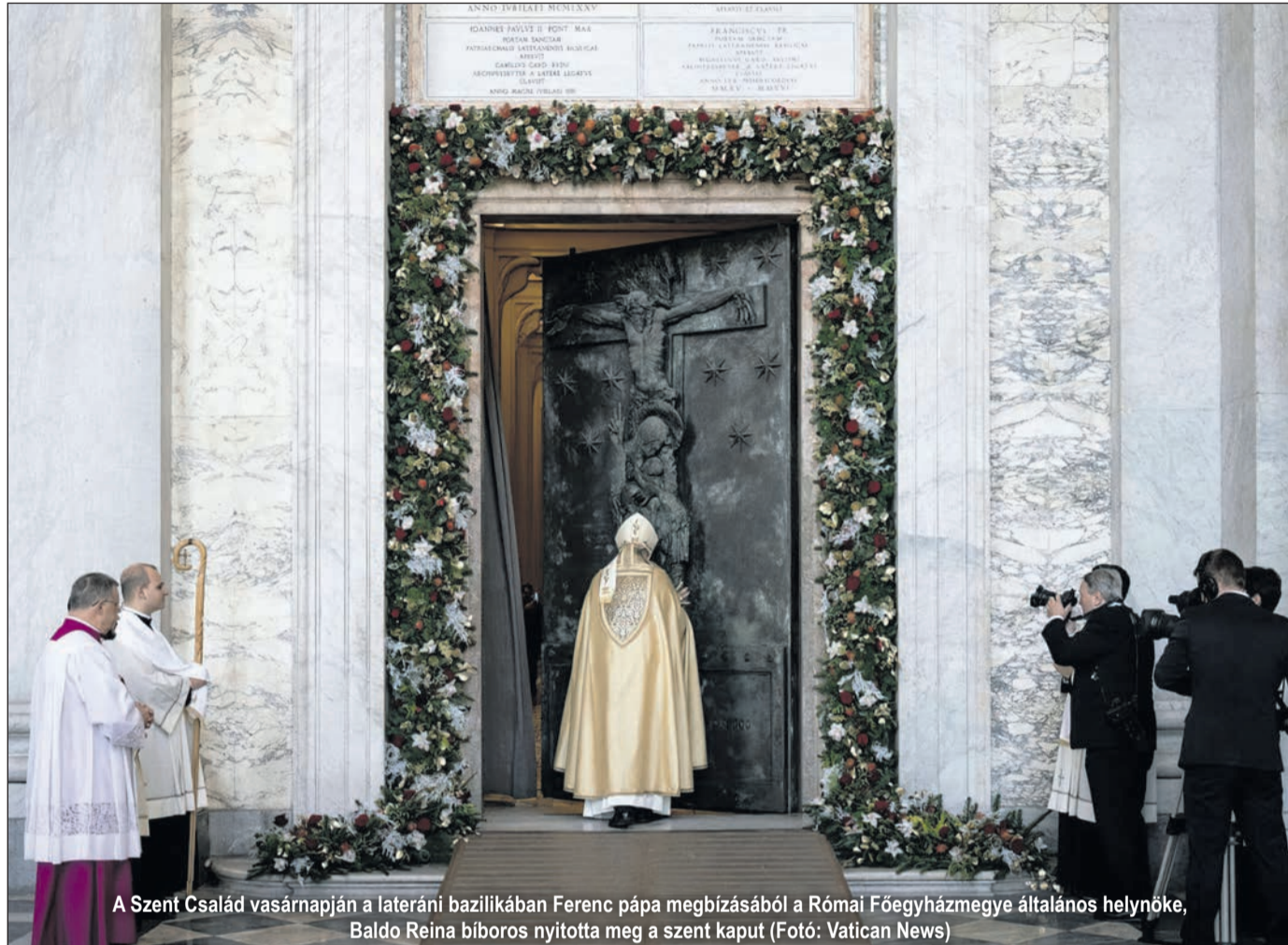
A Szent Család vasárnapján a lateráni bazilikában Ferenc pápa megbízásából a Római Főegyházmege általános helynöke, Baldo Reina bíboros nyitotta meg a szent kaput

(A folytatást a következő számban olvashatják.)