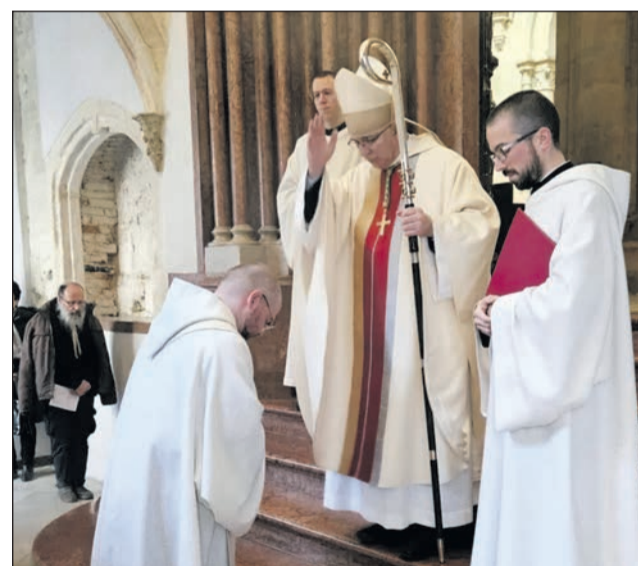
Pannonhalmi Területi Apátság