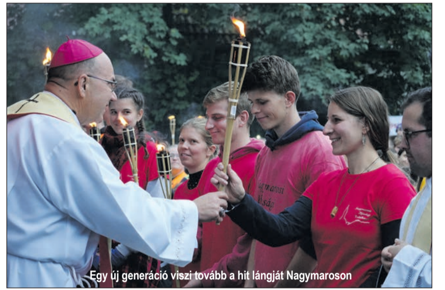
Egy új generáció viszi tovább a hit lángját Nagymaroson