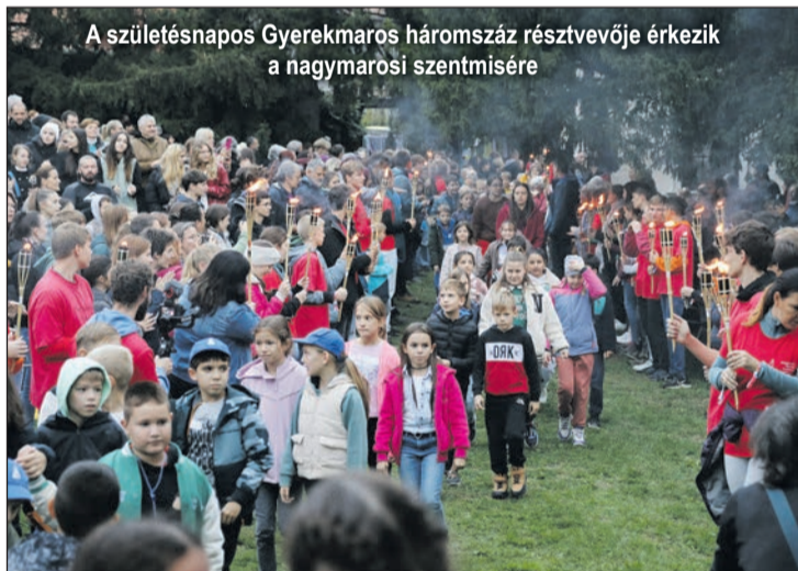
A születésnapos Gyerekmáros háromszáz résztvevője érkezik a nagymarosi szentmisére

A kegyelem nem valami, hanem Jézus maga. Az ünnep maga a kairosz: azt jelenti, Istennel vagyok; ha Krisztust veszem magamhoz, az örök életet veszem magamhoz. Amikor ünneplünk, azt tudatosítjuk, hogy „benne élünk, mozgunk és vagyunk” (ApCsel 17,28). A kairosz az örök élet előíze, olyan, mint egy jó beszélgetés, jó olvas-