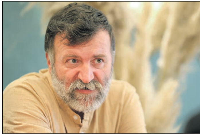
Örökbecsű figyelmeztetés Szent Páltól: ne téj aludni haraggal a szívedben

veszi a szürkeség, szükség van arra, hogy az ember kimosduljon ebből, függetlenül attól, hogy a házaspár katolikus, keresztény vagy nem hívő.