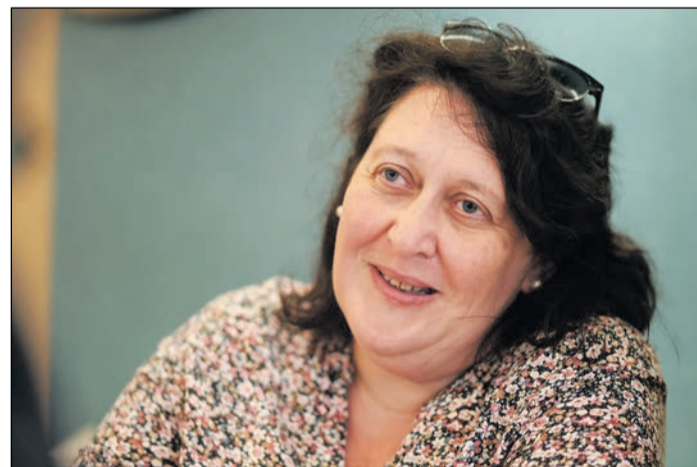
Három alapvető dolog határozza meg a házasságot: a szellemi, a lelki és a testi kapcsolat

K. Zs.: Három alapvető dolog határozza meg a házasságot: a szellemi, a lelki és a testi kapcsolat. A szellemi kapcsolat lényege a kommunikáció, a lelki a közös imádság, a testi kapcsolat pedig az érintés, vagyis a szexualitás, bár inkább az intimitás szót használnám. A Házás Hétfége célja, hogy ráirányítsa a házaspárok figyelmét ezek kiemelkedő jelentőségére. Ha ugyanis ezek a területek megfelelően működnek, biztos, hogy rendben lesz a házasságuk.