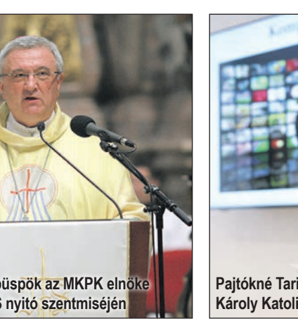
Veres András püspök az MKPK elnöke a KATTÁRS nyitó szentmiséjén