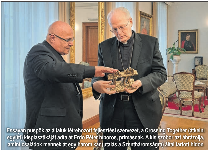
Essayan püspök az általuk létrehozott fejlesztési szervezet, a Crossing Together (átkelni együtt) kisplasztikáját adta át Erdő Péter bíboros, prímásnak. A kis szobor azt ábrázolja, amint családok mennek át egy három kar (utalás a Szentháromságra) által tartott hidon

san, akik eredetileg más felekezetekhez tartoztak, szívesen csatlakoztak a római katolikus közösséghez.