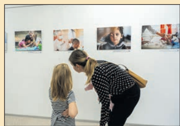
Fotóink kiállítása Győrben