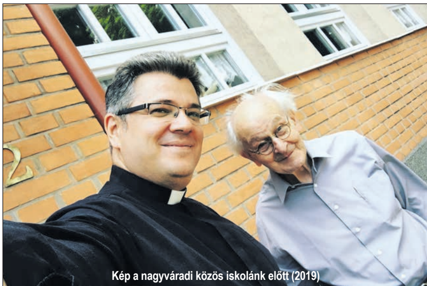
Kép a nagyváradai közös iskolánk előtt (2019)