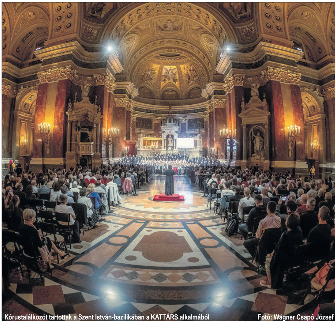
Kórustalálkozót tartottak a Szent István-bazilikában a KATTÁRS alkalmából

LXXX. évf. 40. • (3971.) 2024. október 6. • Ára 420 Ft