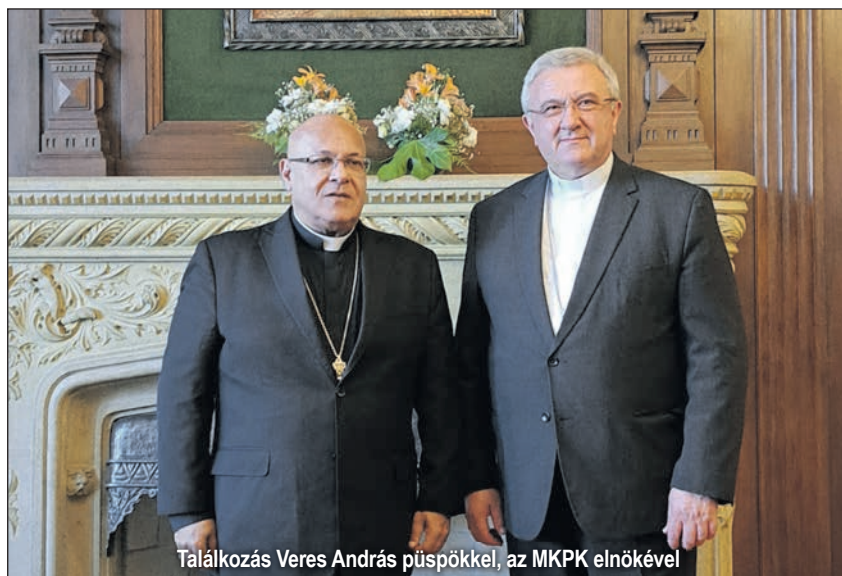
Találkozás Veres András püspökkel, az MKPK elnökével

volt. Napjainkra viszont a keresztények aránya 20-25%-ra csökkent. Bár egyes statisztikák szerint a keresztények aránya növekedni fog, jelenleg, főleg a háborús események fényében és a szíriai menekültek jelenléte miatt, ez aligha látszik valószínűnek. Az elmúlt évek politikai és gazdasági válsága miatt nagyon sok libanoni hagyta el az országot, és közülük nagyon sok volt a keresztény. Igaz viszont, többségük szeretne visszatérni Libanonba. A jelenlegi helyzet nagy nyomással nehezíti a keresztény közösségre, és sok belső feszültséget és megosztottságot okoz. Szent II. János