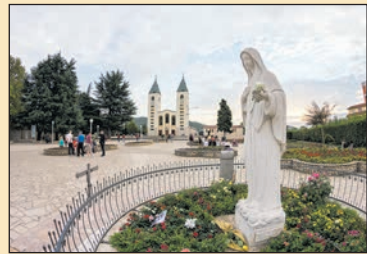
A Medugorjében kialakult kultuszról