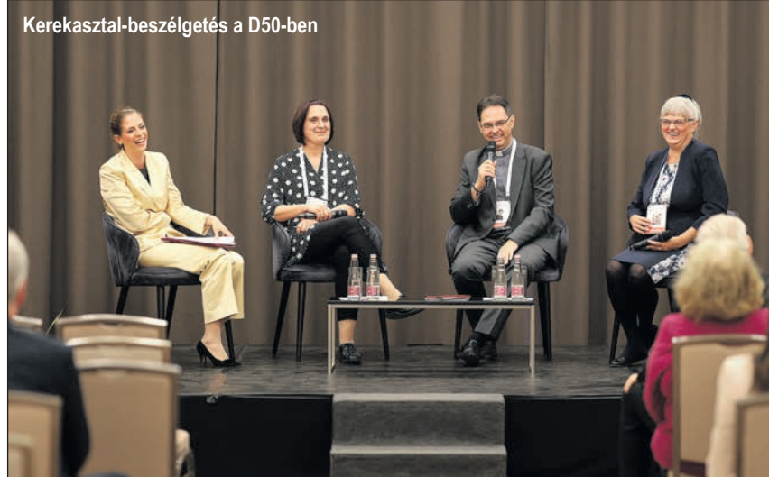
Kerekasztal-beszélgetés a D50-ben