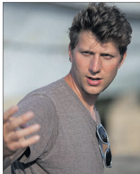
Jeff Nichols amerikai függetlenfilmes rendező

Hasonló témát feszeget Nichols öt évvel későbbi filmjében is, ahol természeti katasztrófa (vagy annak rémképe) helyett a társadalmi közeg lehetetlenít el egy házasságot: a Loving (2016) egy fehér férfi (Joel Edgerton) és egy fekete nő (Ruth Negga) szerelmét meséli el, akiket tiltott vegyes házasságukért letartóztattak a hatvanas évek Virginiájában. Az ezután kezdődő hosszaz jogi procedúra hiába bizonyul végül úttörőnek (hiszen a legfelsőbb bíróság kimondja a tiltó törvény érvénytelenségét), az események alaposan próbára teszik a pár kapcsolatát. A melodramatikus hangütésű