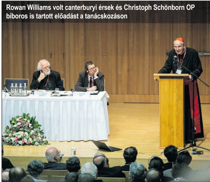
Rowan Williams volt canterburyi érsek és Christoph Schönborn OP bíboros is tartott előadást a tanácskozáson

Az előadó szerint az Egyház vízióját veszítette. Napjaink „ögyelgése” helyett újra meg kellene találnia az irányítót, számot kellene vetnie a veszteségekkel, s az evangéliumból kiindulva reményt kellene adnia az embereknek.