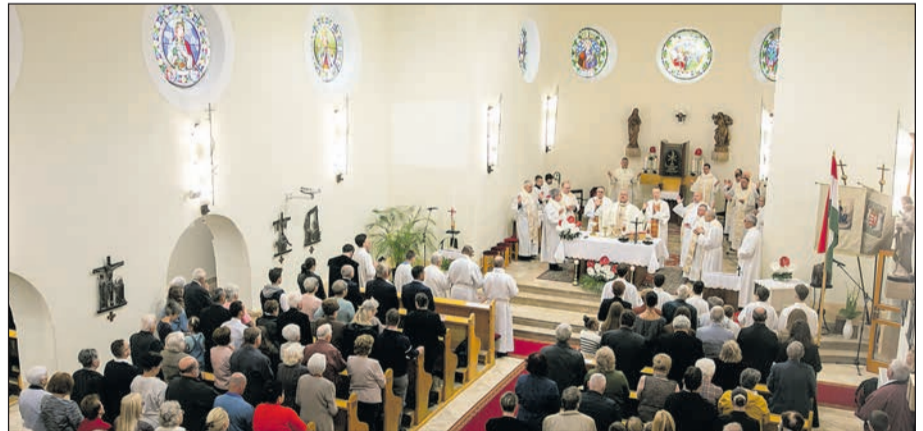
Időkapcsolat helyezték el a templom falában