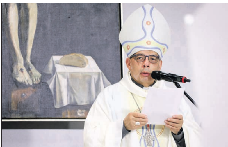
Alfredo José Espinoza Mateus SDB quitói érsek, Ecuador prímása az 52. Nemzetközi Eucharisztikus Kongresszuson, Budapesten

Amit a quitói nemzetközi eucharisztikus kongresszusról tudni kell