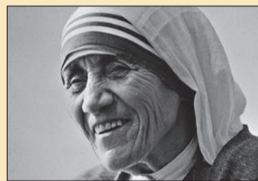
A hét szentje: Kalkuttai Szent Teréz 4. oldal