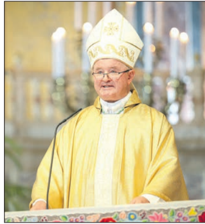
Aurel Percă bukaresti érsek-metropolita

túrák értékeit és gazdagságát. Nem könnyű egy olyan világban élni, ahol a házasság és a család alapvető értékei veszélyben vannak. Az egyik alapvető veszély ezen a területen a genderideológiából ered, amely tagadja a férfi és a nő közötti különbséget és természetes kölcsönös kiegészítést, s amely egy nemi különbségek nélküli társadalmat állít elénk, és elbagatellizálja a család antropológiai szerepét. Nem könnyű kereszténynek lenni egy olyan világban, amely szolgái hódolattal adózik az ősi aranyborjúnak, a pénz kultuszának új és kegyetlen