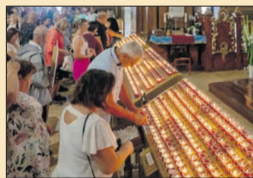
Görögkatolikus nagybúcsú Máriapócsón 11. oldal

Megjelent az Új Ember 2025-ös Kalendárium