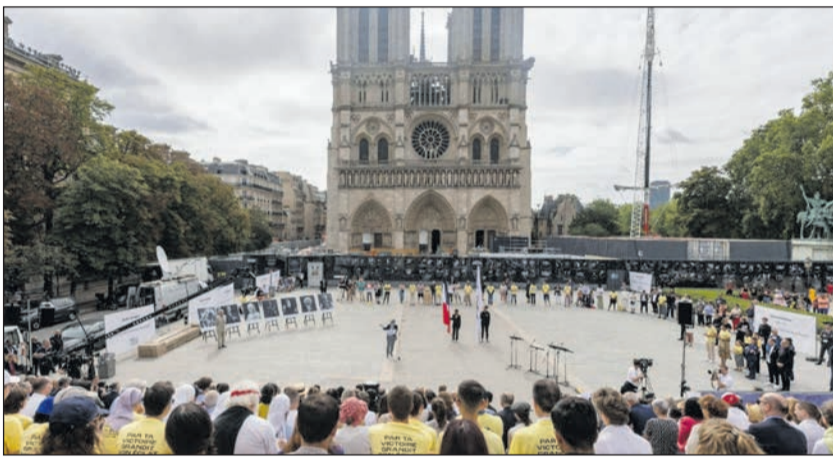
Az olimpia alkalmából augusztus 4-én a Notre-Dame előtt tartott vallásközi találkozó