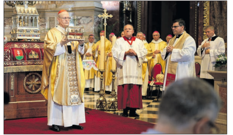
Erdő Péter bíboros, prímás a szentmise végén áldást adott a Szent Jobb-ereklével