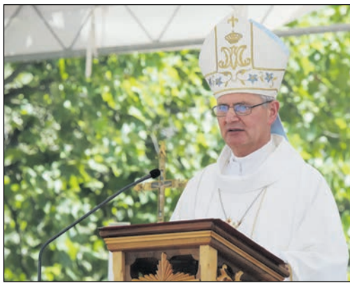
Schönberger Jenő szatmári megyéspüspök volt az ünnepi szentmise főcelebránsa és szónoka

Idén is több ezer hívő ünnepelte együtt a Debrecen-Nyíregyházi Egyházmegye búcsúját július 28-án Máriapócsra. Az ünnepi szentmise főcelebránsa és szónoka Schönberger Jenő szatmári megyéspüspök volt. A liturgián részt vett Palánki Ferenc debrecen-nyíregyházi megyéspüspök, Bosák Nándor nyugalmazott debrecen-nyíregyházi megyéspüspök, az egyházmegye papsága, papnövendékei és hívei.