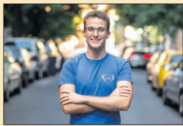
A Tiszafit ifjúsági találkozó Interjú a szervezővel a 9. oldalon