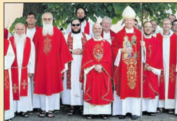
Papszentelés a kapucinusoknál 11. oldal