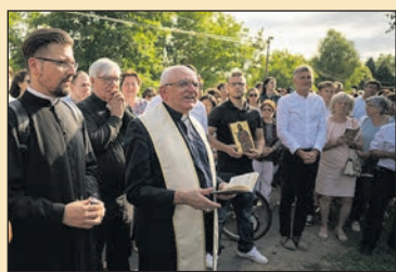
Megnyílt a Fazenda - együtt a szenvedélybetegéért 8. oldal