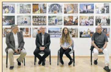
Szent pillantások személyes közelségben A Keresztény Múzeum Képgaléria című tárlatról 8. oldal