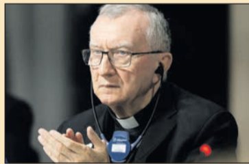
Parolin bíboros a svájci békekonferenciáról 2. oldal