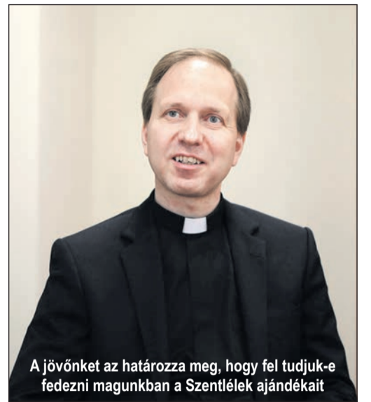
A jövőnkét az határozza meg, hogy fel tudjuk-e fedezni magunkban a Szentlélek ajándékait

– Ekkor lejárt a püspökkari titkári mandátumom, és ismét egy sok változást hozó év következett számomra. Nyártól kineveztek a római Pápai Magyar Intézet rektorának. Nagy kihívás volt lezárni kapcsolatokat, és ezer kilométerrel távolabb bekapcsolódní egy másik kultúrába. Szeptemberben elkezdtem a tanévet, de alig telt el egy hónap, és a Szent- atya kinevezett segédpüspöknek. Egy átmeneti állapot vette kezdetét,