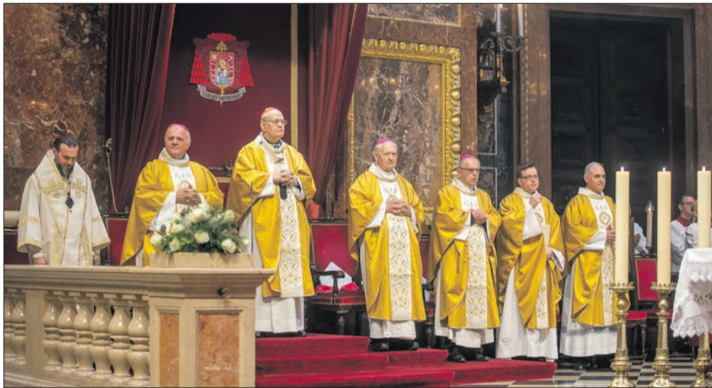
Mohos Gábor esztergom-budapesti segédpüspök ezüstmiséje a Szent István-bazilikában számos főpap koncelebrálásával