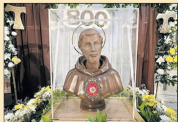
Egyiptomban járt Szent Ferenc tunikája 12. oldal