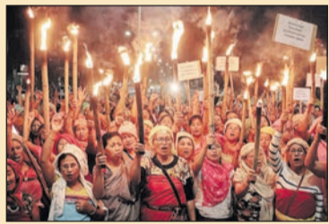
Keresztények és hinduk béketárgyalása Indiában 7. oldal