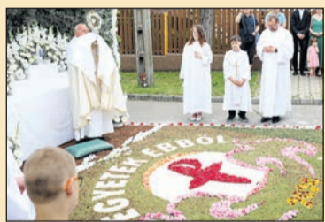
Úrnap virágszőnyeg Pilisvörösváron 8. oldal