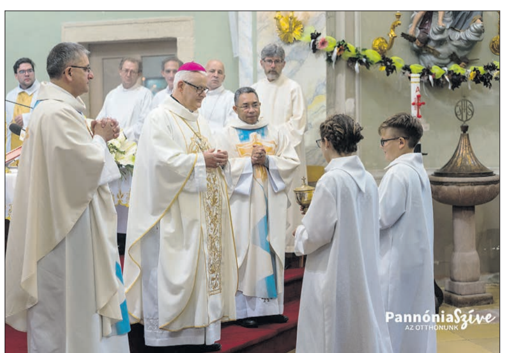
PannóniaSzíve AZ OTTHONUNK