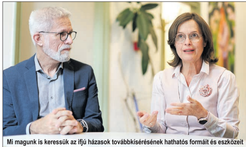
Mi magunk is keressük az ifjú házások továbbkísérésének hathatós formáit és eszközeit

K. Cs.: Párkapcsolati tanácsadóként az a tapasztalatunk, hogy a házasság első éve komoly kihívást tudnak jelenteni a párok számára. Ilyenkor egyre