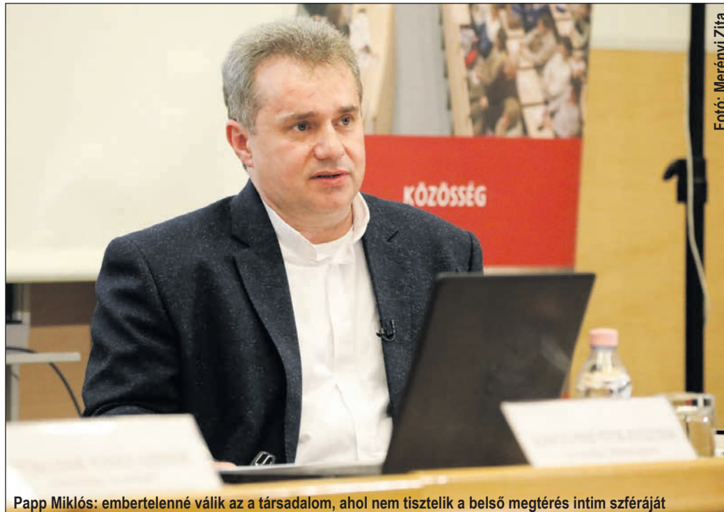
Papp Miklós: embertelenné válik az a társadalom, ahol nem tisztelik a belső megtérés intim szféráját

Am a gyónásban Isten csak a megkérdőjelezhetetlen, objektív rendet védi, hanem egyszerre határtalan irgalmát is közvetíti: te több vagy, mint a bűnöd. Ez a személyes méltóság tisztelete. Isten hisz az emberben. A személyes méltóságban való hit fontos a gyónó és természetesen az áldozat számára is. A személyes méltóság komplexitásának tagadása az, ha valakit a sebeivel, áldozatszerepével vagy éppen