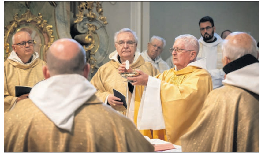
Gyémántmise a Tihanyi Bencés Apátság templomában

– Papként megtapasztaltam, hogy emberség kell a papsághoz. Odafigyelés. Ráérzés. Empátia. Együttérzés. Szolidaritás. Nem én oldom meg a másik ember problémáit. Csupán segíteni tudok, hogy elfogadhassa az Úr segítségét. Megtapasztaltam azt is, hogy bátran kell szólni, akár alkalmas, akár alkalmatlan. Határozottan képviselni kell az evangéliumi