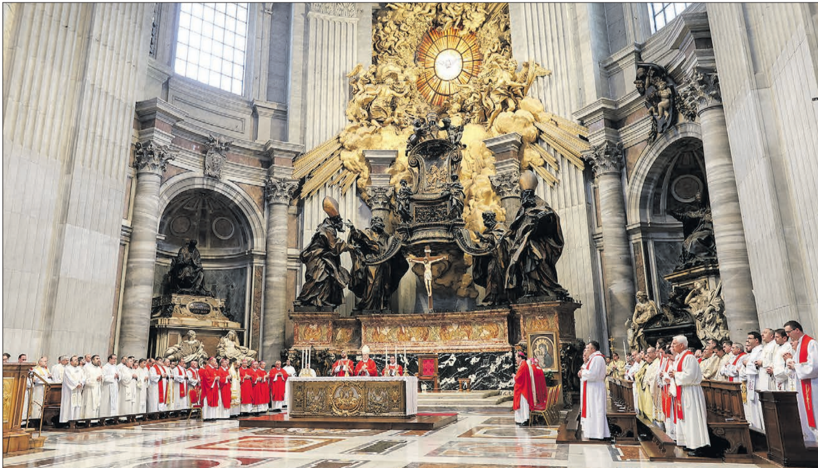
Erdő Péter bíboros, prímás volt a háromnapos Nemzeti Zarándoklatot záró szentmise főcelebránsa a Szent Péter-bazilikában