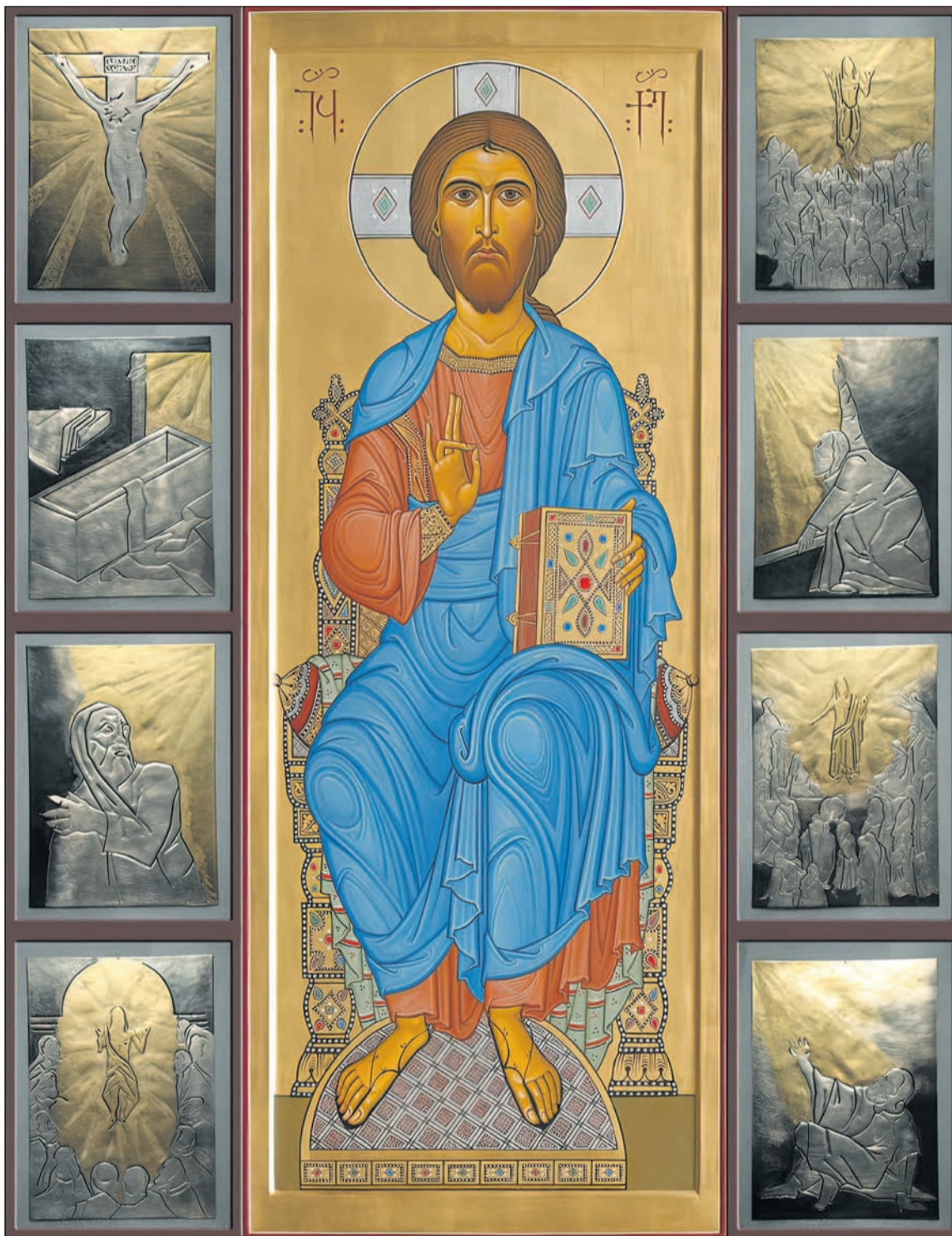
A Feltámadt Krisztus (A római Szent Lépcső Sancta Sanctorum-kápolna)

Am mégsem mondhatjuk, hogy ettől kezdve csak folyamatosan árad a fény. Hisz a betlehemi barlang is hamarosan újra sötétségbe borul. Sőt, Júdea egész vidéke is, amikor Heródes kereszti a gyermeket, hogy megölje, s a biztonság