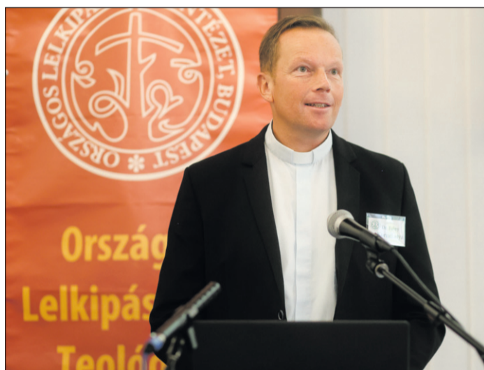
Fábry Kornél püspök: Fontos tudnunk papként, hogy mik az erősségeink, gyengeségeink, mi várható el tőlünk, mit jelent együttműködni a munkatársakkal