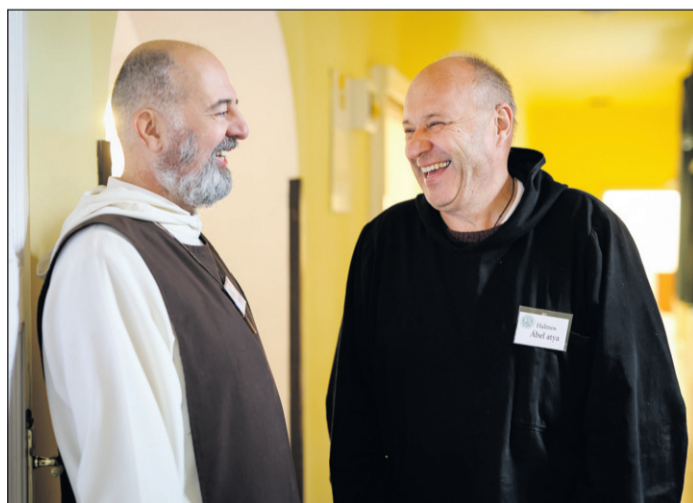
A máriabesnyői találkozón elhangzott: „Nagyon fontos a megosztás: Egymásnak sokat tudunk adni.”

hogy tudjuk vezetőként jobban építeni Krisztus testét” – mutatott rá a követendő útra. A vezetőnek figyelembe kell vennie személyes adottságait, ez alapján látni, mi várható el tőle, és mi nem, de az, hogy akarjon növekedni vezetőként is, felelősséget vállalva, víziót hordozva, akár egyedül is kiállva ez a kötelesség.