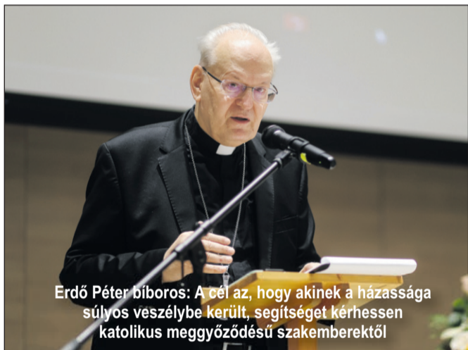
Erdő Péter bíboros: A cél az, hogy akinek a házassága súlyos veszélybe került, segítséget kérhesen katolikus meggyőződésű szakemberektől

Ha hajlandó vagyok ajándékként elfogadni magam minden sebemmel, korlátolt-ságommal együtt olyanok, amilyen vagyok, az megkönynyíti a felebaráti szeretetet – folytatta beszédét. – Ha szeretet szúr a másik bűne, azt a dolgot valójában magamban nem szeretem. Mindig azt piszkáljuk a másikban, ami bennünk takarásban van, és nem akarunk szembesülni vele. Isten tudja, milyennek kell lennie a másiknak, ő is az ő szeretetajándéka. Ha megbé-