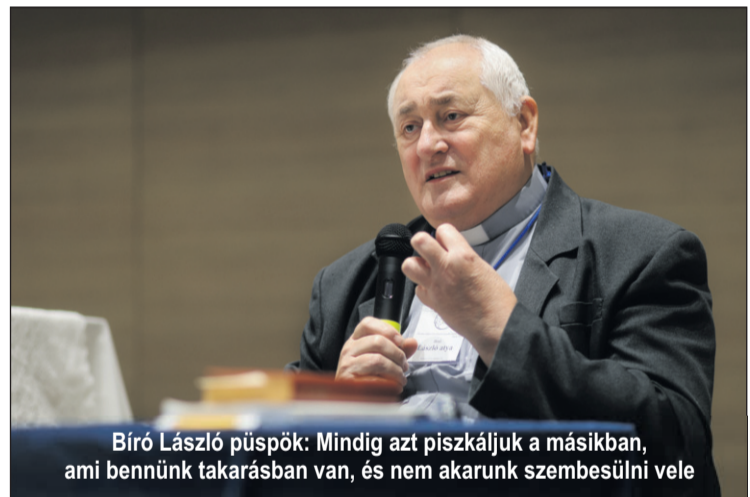
Bíró László püspök: Mindig azt piszkáljuk a másikban, ami bennünk takarásban van, és nem akarunk szembesülni vele

gálni a házasságukat. Elég sokan voltak olyan elváltak is, akik évtizedek óta nem járultak szentáldozáshoz, mert úgy gondolták, nem tehetik, bár nem éltek új kapcsolatban, és nem kötöttek új házasságot. A válás miatt lehet az emberekben lelkiismeret-fordulás amiatt, hogy vajon mennyiben voltak okozói a kapcsolatuk megromlásának, és milyen kárt tettek ezzel a gyermekekben. Az érintettek ugyanakkor keresik, hogyan hozhatnák rendbe mindezt. A bíboros hangsúlyozta, egy gyónásban le lehet tenni ezeket a terheket. El lehet jutni odáig, hogy valaki azt mondja: amit elrontottam, nem lehet helyrehozni, de teszek valami jót, ami segíti mások életét. Bár elvált keresztény vagyok, bekapcsolódhatok a szentségi életbe, mint mindenki más. A bíboros rámutatott: ez az üzenet sokakra felszabadító erővel hatott.