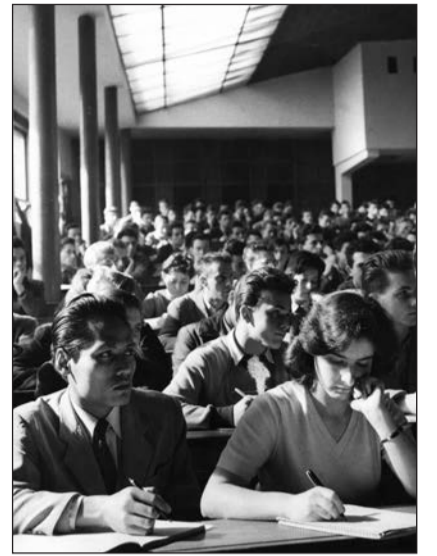
Évfolyamelőadás a Műegyetemen (1960)

A vallásukat gyakorló fiatalokat ért mindennapi hátrányok története mindmáig feldolgozatlan. A témával foglalkoztak vallásszociológusok, jogtörténészek és társadalomtörténészek is, de szisztematikus kutatásában még nem került sor. A mindennapi hátrányok feldolgozása fájó hiány a társadalom emlékezetében, ahogyan hi-