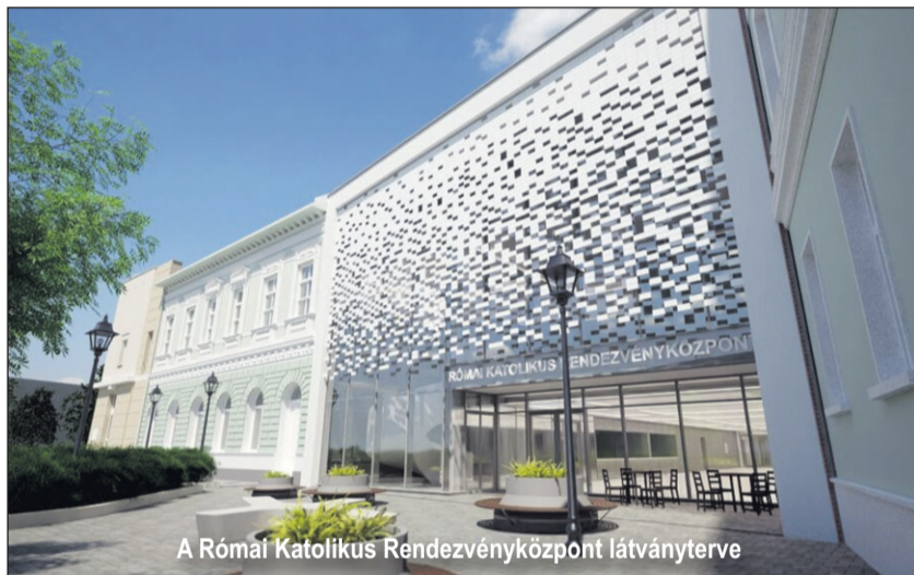
A Római Katolikus Rendezvényközpont látványterve

értetlenkedik, de rábizza magát Istenre, készséggel igent mond, majd az angyal eltávozik, és még nagyobb lesz a sötétség, mert Mária nem tud-