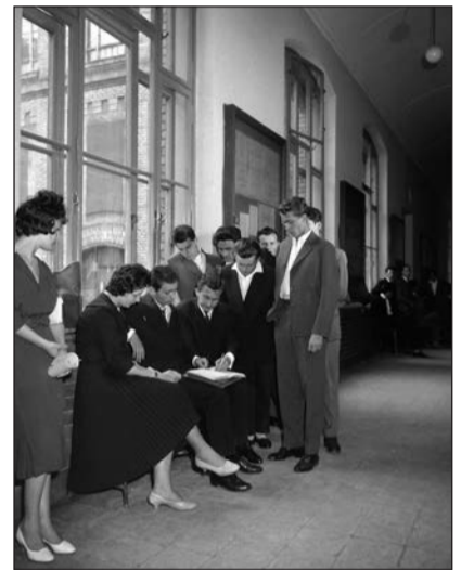
Órák közötti szünetben a Műegyetemen (1961)

ányzik a Kádár-korszak társadalomtörténetéről szóló munkákból is. Pedig vizsgálatával árnyaltabb képet kaphatnánk a kádári hatalomgyakorlás természetéről, a korszak ifjúság- és egyházpolitikájának „munkamódszeiről”, illetve a különböző értelmiségi szakmák társadalmi összetételének, utánpótlásának változásairól is.