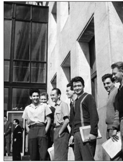
Mérnökhallgatók Miskolcon (1961)

rületek – mindenekelőtt a pedagógus- és a bölcsészpályák – maradtak zárva a vallásgyakorló fiatalok előtt. Bár kivételek akkor is akadtak: források bizonyítják, hogy ideológiai okokból az orvosnak készülőköt is megválogatták, sőt a budapesti kerületi egyetemre jelentkezők esetében is voltak ilyen „szűrők”. Hívó fiataloként legnagyobb eséllyel a műszaki karokra lehetett bekerülni. Több olyan esetről tudunk, amikor az egyházi iskolában érettségiző di-