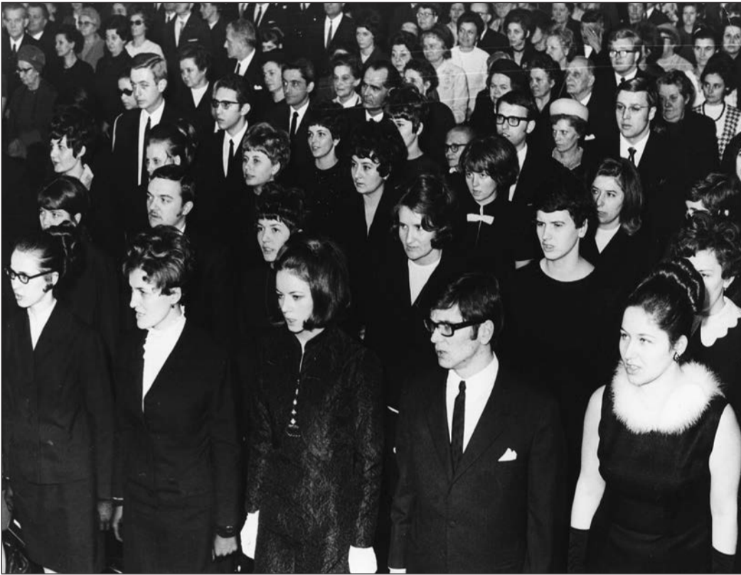
Gyógyszerészavatás a Semmelweis Orvostudományi Egyetemen (1971)

A Kádár-rendszer másodrendű állampolgárainak története leginkább a felsőoktatási felvételik vizsgálatán keresztül ragadható meg. A korszakban elsősorban a humán te-