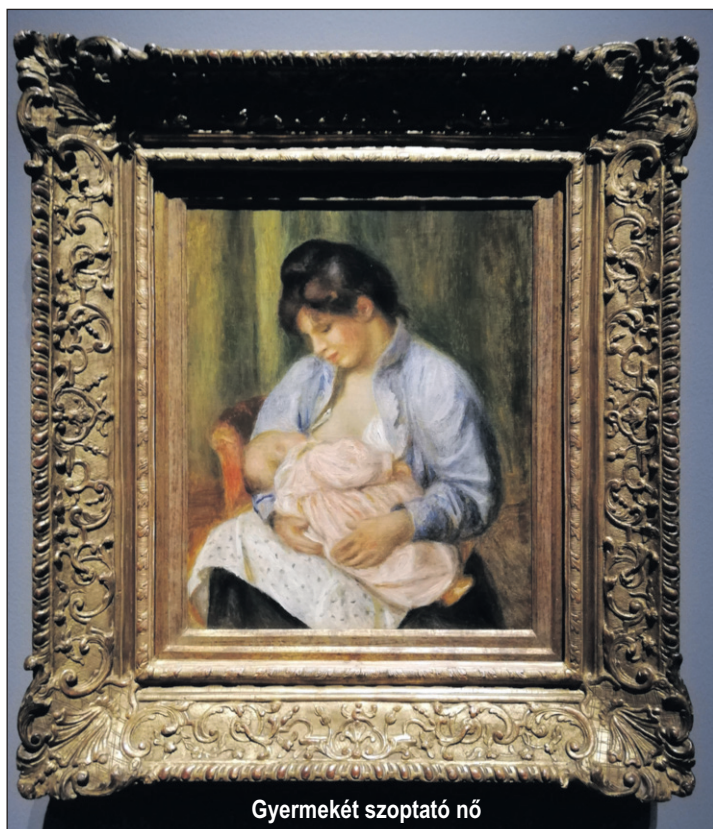
Gyermekét szoptató nő