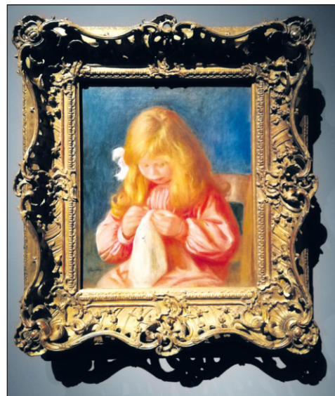
Jean Renoir varrás közben

erősen bámulnak maguk elé, a kép jobb oldalán pedig merész kivágásban a festő öccse éppen cigarettára gyújt. Renoir egyik képe sem akar történetet mesélni, teljességgel hiányzik nála az irodalmiasság, hiszen ő mindig az éppen létező jelent kívánja ábrázolni. Ebben rejlik újdonsága, ha a korának festészeti közegével vetjük egybe. Különlegesen szép kép a fiáról, Jeanról készített festmény, ahol egy aranyhajú gyermeket láthatunk, akiről először azt hittem, hogy lányt ábrázol. Aztán persze rájöttem, hogy a későbbi híres filmrendezőt láthatom itt 1898-ból, két éves korában.