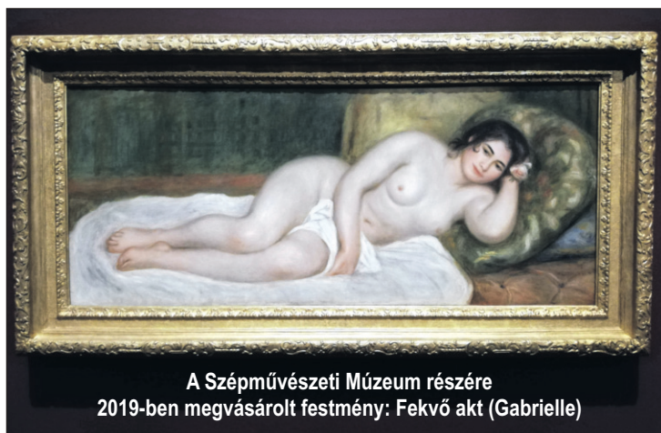
A Szépművészeti Múzeum részére 2019-ben megvásárolt festmény: Fekvő akt (Gabrielle)

kant, mankós öreg, vén ember. De két erős, nagy szemében több az élet, mint száz ifjú emberében. Hangja erős. Csak a teste törött össze. (...) Most falun volt, onnan jött pár hétre Párizsba. Vágyik ide mindig, de nem bír mégsem soká megmaradni. Azt mondja: delejes Párizs levegője és vonzza, hanem nem szabad soká itt maradnia. Nem ám, mert ennek az Erősnek sok Erő kell. Az ő erői pedig már fogyóban vannak. (...) Később néztünk képeket. Nagyon szerettem volna tudni, milyen gondolatok vonultak el a ráncok alatt. És oly keveset árult el belőlük!”