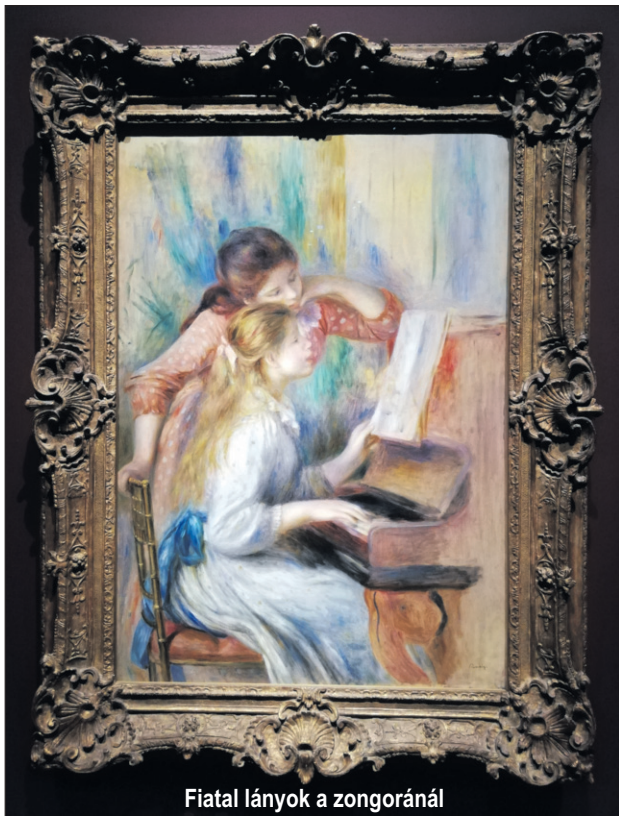
Fiatal lányok a zongoránál

Renoir egész életművében megfigyelhető, hogy sem a portréin, sem az egész alakos figuráin, emberábrázolásain nem az egyéniséget keresi, és nem is akar a lélek mélyére hatolni, mint például a 17. században Rembrandt, a magyar festők közül Mednyánszky, vagy az oroszoknál Repin. Érdekes, hogy ugyanezt mondhatjuk Cézanne portréiról is. Ő sem az emberi lélek titkát kutatta, sokkal