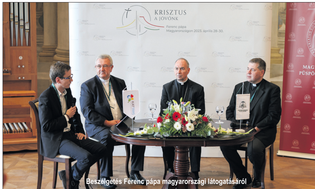
Beszélgetés Ferenc pápa magyarországi látogatásáról