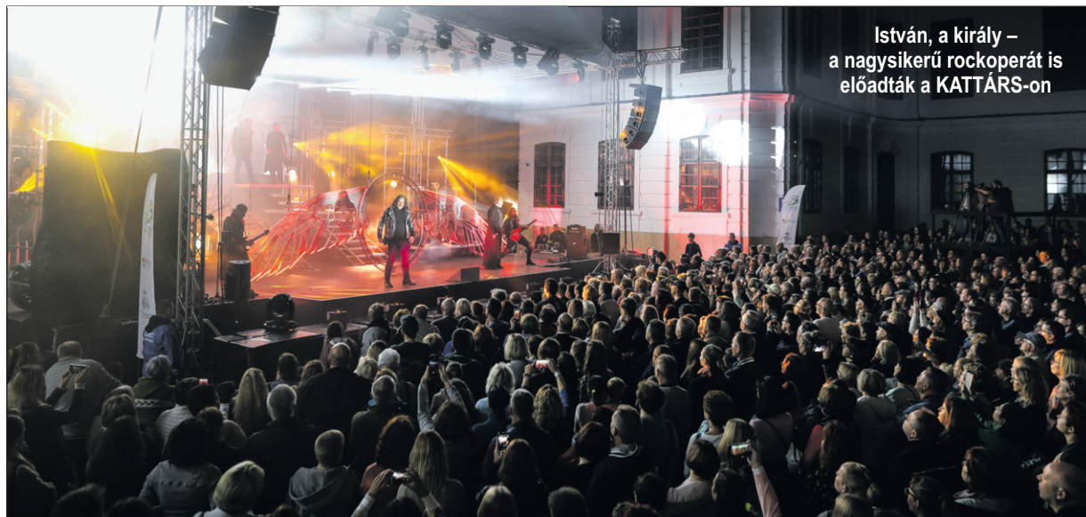
István, a király – a nagyszerű rockoperát is előadták a KATTÁRS-on