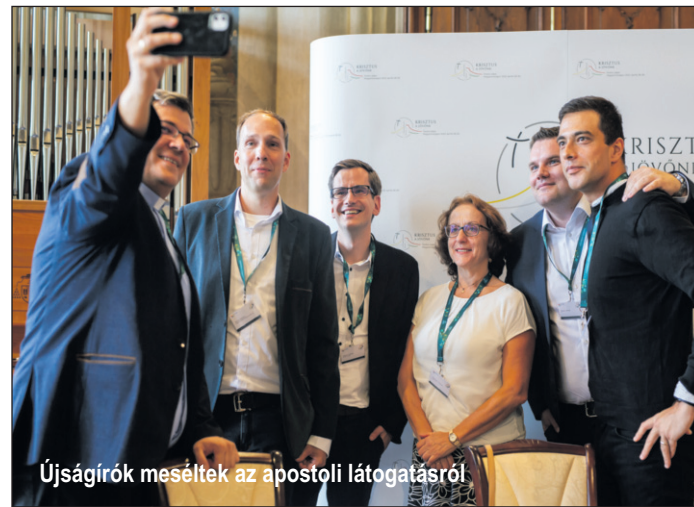
Újságírók meséltek az apostoli látogatásról