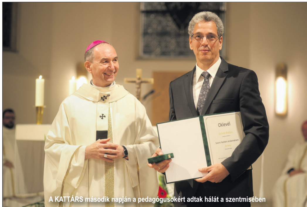
A KATTÁRS második napján a pedagógusokért adtak hálát a szentmisében

Székely János szombathelyi főpásztor, a Magyar Katolikus Püspöki Konferencia Caritas in Veritate Bizottságának elnöke a találkozó második napján tartott szentbeszédében kiemelten szólt mind az oktatás, akik az oktatás-területén tevékenykednek. A szentmisében a Veszprémi Főegyházmegye nevé-