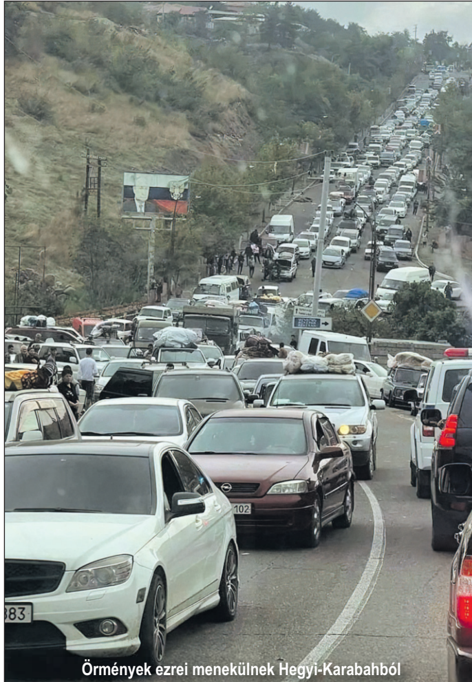
Örmények ezrei menekülnek Hegyi-Karabahból

– Többször jártam Amaraszban, s az ottani templomba belépve azt éreztem: ez a szent hely a keresztény kultúra legkeletibb bástyája. A 4. és 5. században az örmény kereszténység a leginkább meghatározó szentek, Világosító Szent Gergely és Szent Meszrop Mastoc nyomain haladva 1600 év ke-