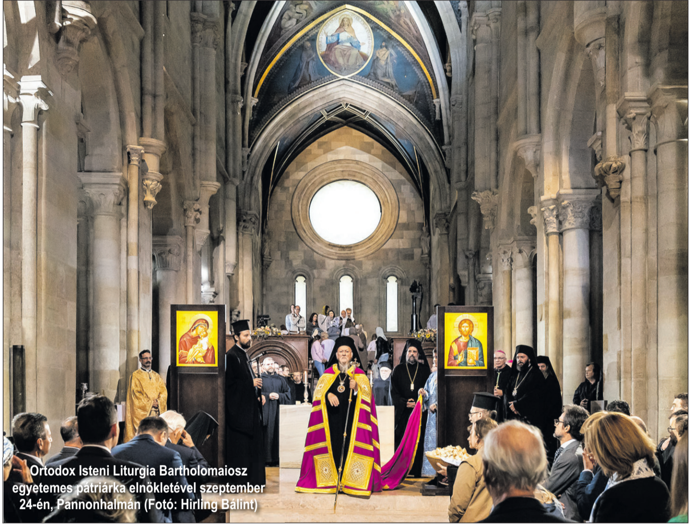
Ortodox Isteni Liturgia Bartholomaiosz egyetemes pátriárka elnökletével szeptember 24-én, Pannonhalmán