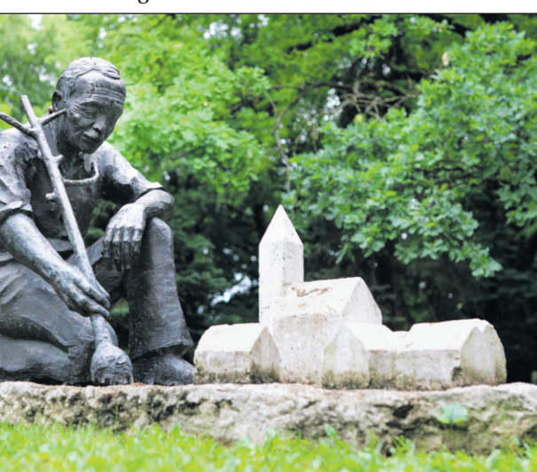
Bukta Imre Faültető című szobra Mezőszemerén

– Sikerült Mezőszemerén egy kisebb kulturális közösséget létrehozni?