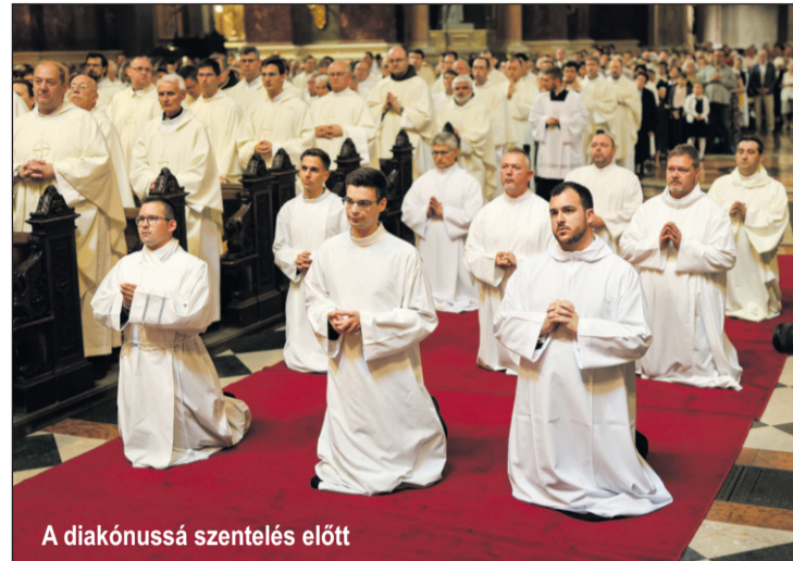
A diakónussá szentelés előtt

majd II. János Pál pápa volt az, aki ezt Fatimában ünnepélyesen megismételte.