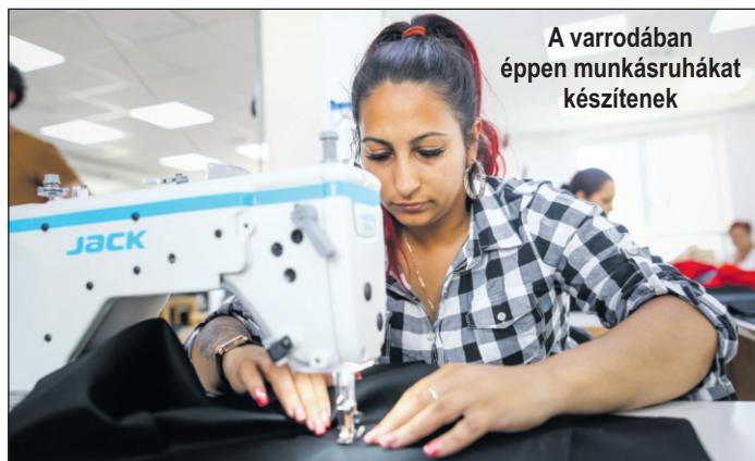
A varrodában éppen munkásruhákat készítenek