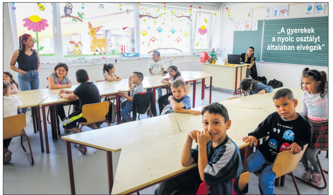
„A gyerekek a nyolc osztályt általában elvégzik”

zéseket. Volt, aki ötvenévesen lett óvó néni. Egy faluban, ahol nincs termelés, ahol nincsenek a közelben nagyvárosok, gyárak, nagy kincs a biztos, ráadásul megbecsült munkahely és a jó közösség. Így ma már minden csoportban szakképzett munkatársak foglalkoznak a gyerekekkel. Zenei és mozgásfejlesztést is tanulnak a pedagógusok, sokat mozognak, táncolnak a gyerekekkel, fáradhatatlanul. Nem is tudom, ez volt-e a nagyobb csoda, vagy az, ahogyan a kicsik fogadtak bennünket: a „Katicák” kedvesen, udvariasan köszöntöttek minket, amikor az álomba ringató mese előtt váratlanul benéztünk hozzájuk. „Amint belépnek a kapun, az óvoda szabályai szerint viselkednek. Itt bent nincsenek agresszív gyerekek,