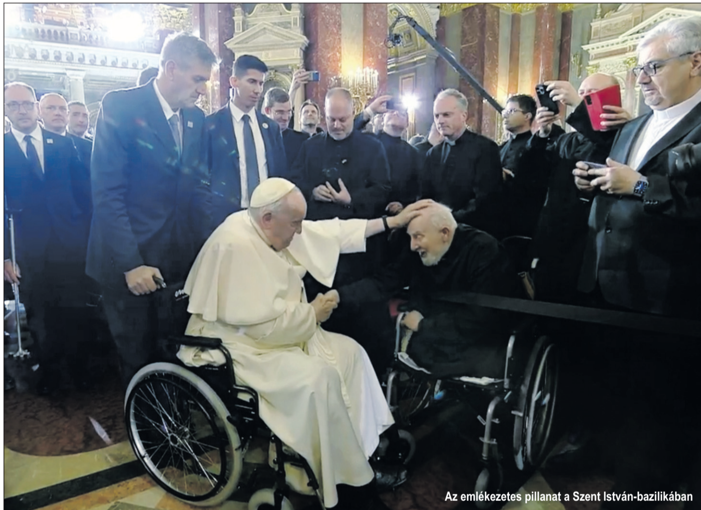
Az emlékező pillanat a Szent István-bazilikában

eredeti helye, így visszatért a zsidó vallásra. Idősotthont alapított és vezetett a zsinagóga mellett, Auschwitzot megjárta emberek éltek ott. De volt egy adventista lelkész is, és egy angolkisasszony főzött, aki kóser konyhát vitt. Apám útkereső volt. 1958-ban megújította a keresztiségi fogadalmát, és őszintén hívó katolikus lett. Eleinte még az állami ünnepeken is templomba akart menni.”