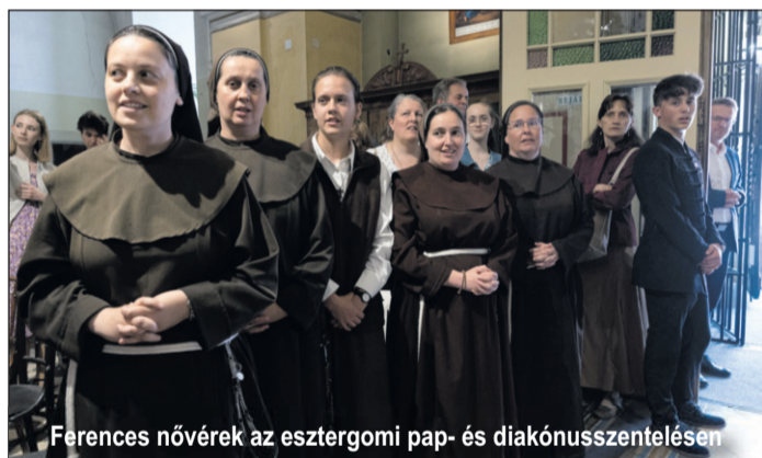
Ferences nővérek az esztergomi pap- és diakónusszentelésen