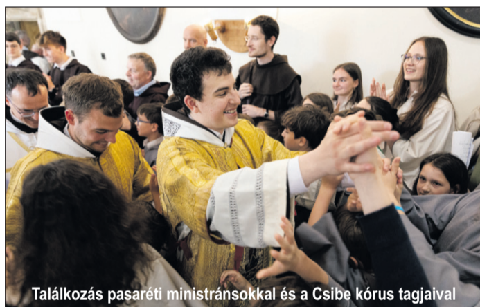
Találkozás pasaréti ministránsokkal és a Csibe kórus tagjaival