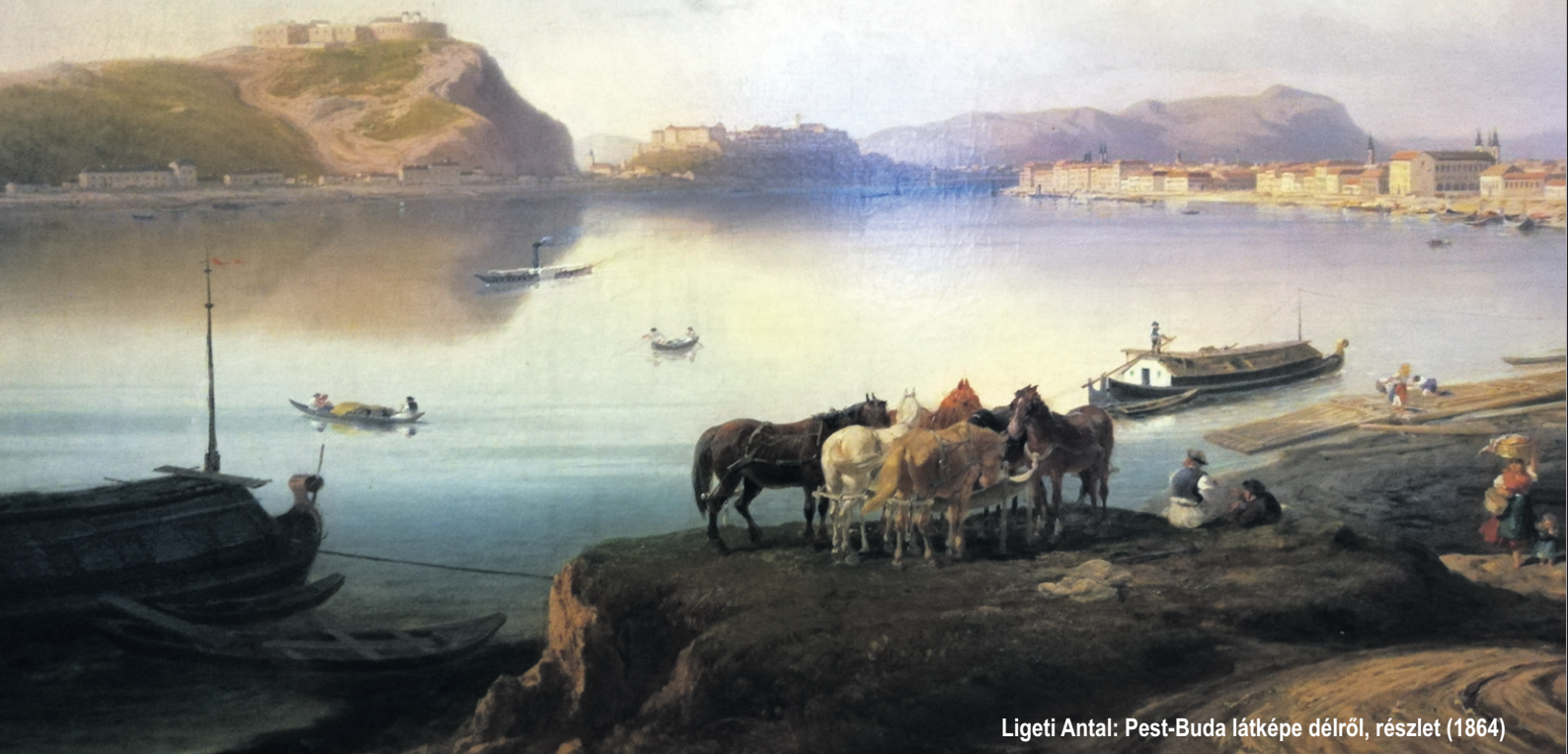
Ligeti Antal: Pest-Buda látképe délről, részlet (1864)