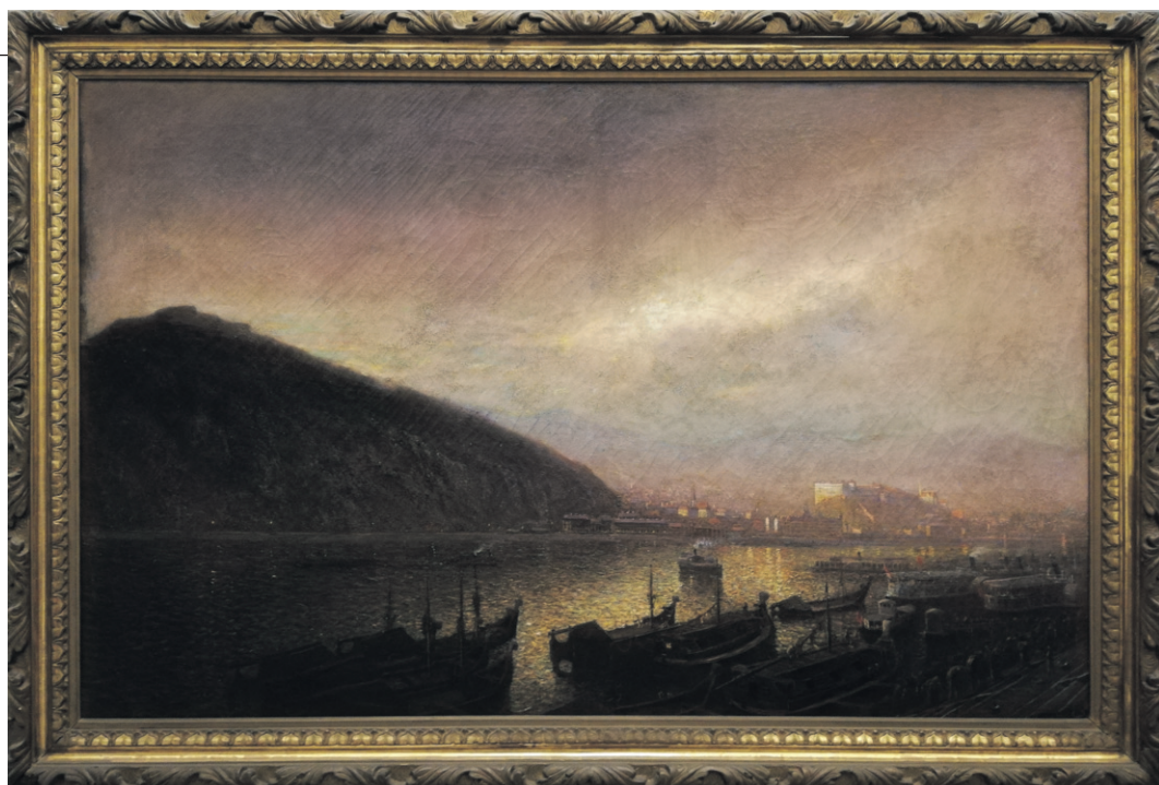
Mednyánszky László: A budai Duna-part (1900)

Az 1900-as évek elejétől azonban egyre jobban kezdett tért hódítani a fényképezés. Sorra nyíltak Pesten is a fotóatelier-k, a műtermek, s ezzel párhuzamosan háttérbe szorult a 19. század romantikus, realista városképábrázolásai iránti igény. Az állandóan változó, átépített vagy éppen pusztuló épületek, műemlékek külső képeinek megőrzésében a festmény már nem tudt versenyezni a olcsóbb, egyszerűbb és hitelesebb fényképpel. Így a festménypályázatnak nem lett folytatása, az újabb városi megrendeléseket már a fényképező Klösz György kapta.