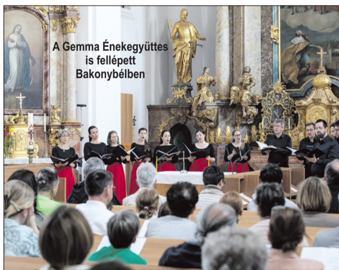
A Gemma Énekegyüttes is fellépett Bakonybélben