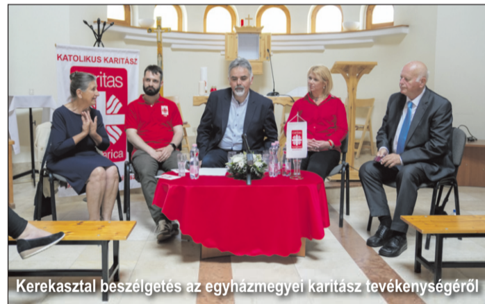
Kerekasztal beszélgetés az egyházmegyei karitás tevékenységéről

Felvetődik hát a kérdés: jelent-e közös identitást az egyházmegyéhez tartozás? Igen. A közös út, amit az Egyház szolgálattévői bejártak, a feladatok közös megfogalmazása a szinodális folyamat során s a közös élmények mindenképpen egységbe kovácsolták az egyházmegye tagjait, ahogyan a szegényekről való gondoskodás is.