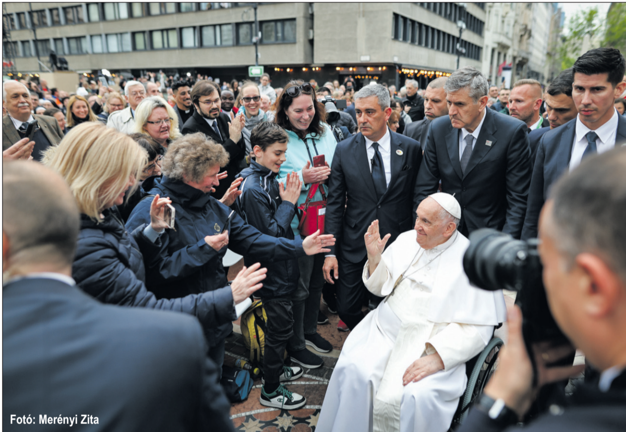
Fotó: Merényi Zita

ten üzenetét, valamint ismét el kell gondolkodnunk a krisztocentrikus hitoktatás lényegéről” – foglalta össze. Hozzátette: „Mi úgy készültünk a pápalátogatásra, hogy a gyerekekkel elimádkoztunk minden hittanon a püspöki konferencia által kiadott