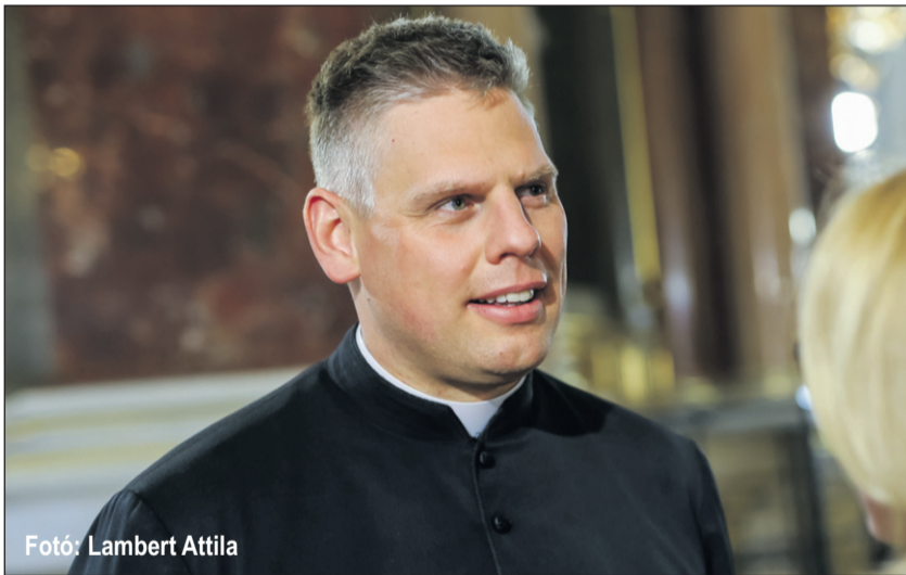
Fotó: Lambert Attila