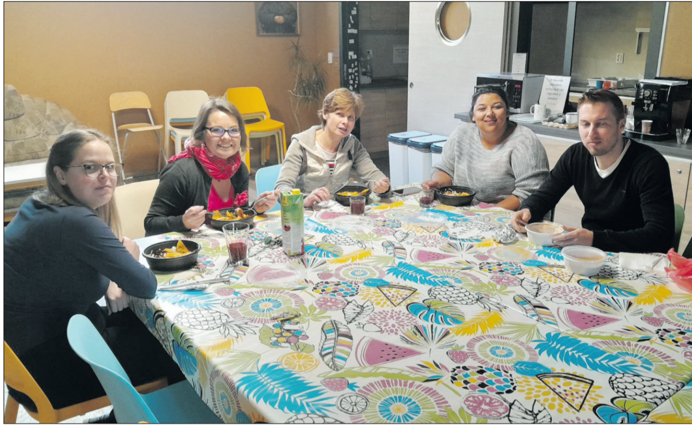
Az ebéd inspiráló szakmai beszélgetés alkalmá is

– A Marvelli Coworking az Óbudai Segítő Szűz Mária-kápolna és az óbudai szalézi rendház szomszédságában található. A közösségi irodának helyszínt adó Don Bosco Közösségi Ház és Oratórium (1032 Budapest, Kiscelli utca 79.) megközelíthető a Bécsi út felől is. A 17, 19, 41-es villamosok megállója két perc sé-