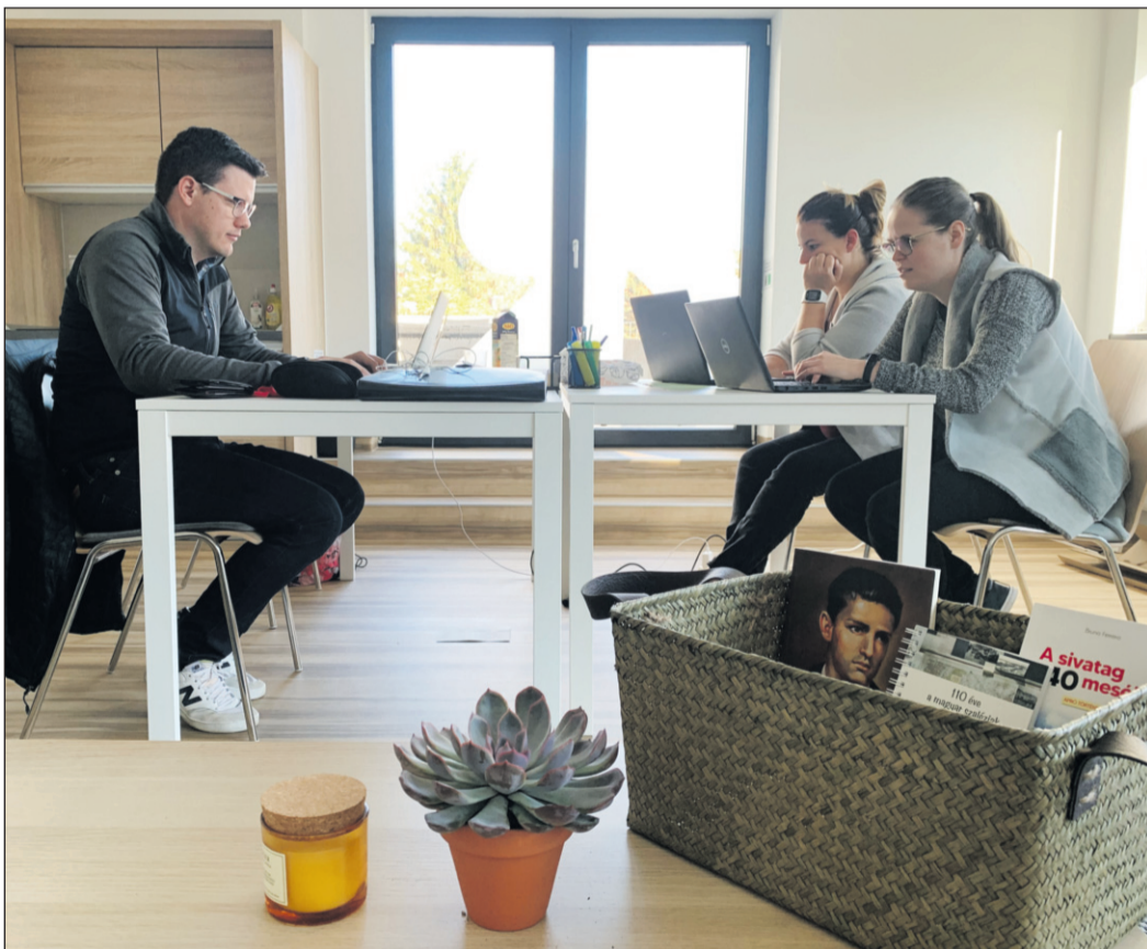
Fókuszáltabban, eredményesebben – egymás társaságában

– A Marvelli Coworking az óbudai szalézi rendház szom-