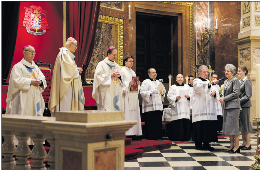
„...azon a helyen, ahol Erdő Péter bíboros Salkaházi Sárát boldoggá avatta”

A kereszténység arra mutat rá, hogy létezik objektív erkölcsi törvény. Ez a gondolat a nyugati felvilágosodástól kezdve elhomályosult. A modern ember nem megismerni, hanem használni akarja a valóságot – hangsúlyozta Székely János püspök. Margit testvér kiállt az objektív erkölcsi rend mellett, de nem volt politikai alkat, elvi kérdésekben nem volt hajlandó kompromisszumra. A materializmus előbb-utóbb romlásba visz – mondta egy beszédében. Szerinte az emberi jogok végső forrása Isten. Slachta Margit valós megoldásokat szorgalmazott a szenvedők és az elesettek problémáira, ezért is kereste azok okait. Ráértett arra, amit Szent II. János Pál pápa a bűnstruktúráinak nevezett. Gyűjtést szervezett a kifosztott erdélyi családok számára, küzdött a munkakeresők nyilvántartásáért, a nyolcosztályos oktatásért, a szegények lakhatásáért. Megalapította a cselédnők Szent Zita-körét,