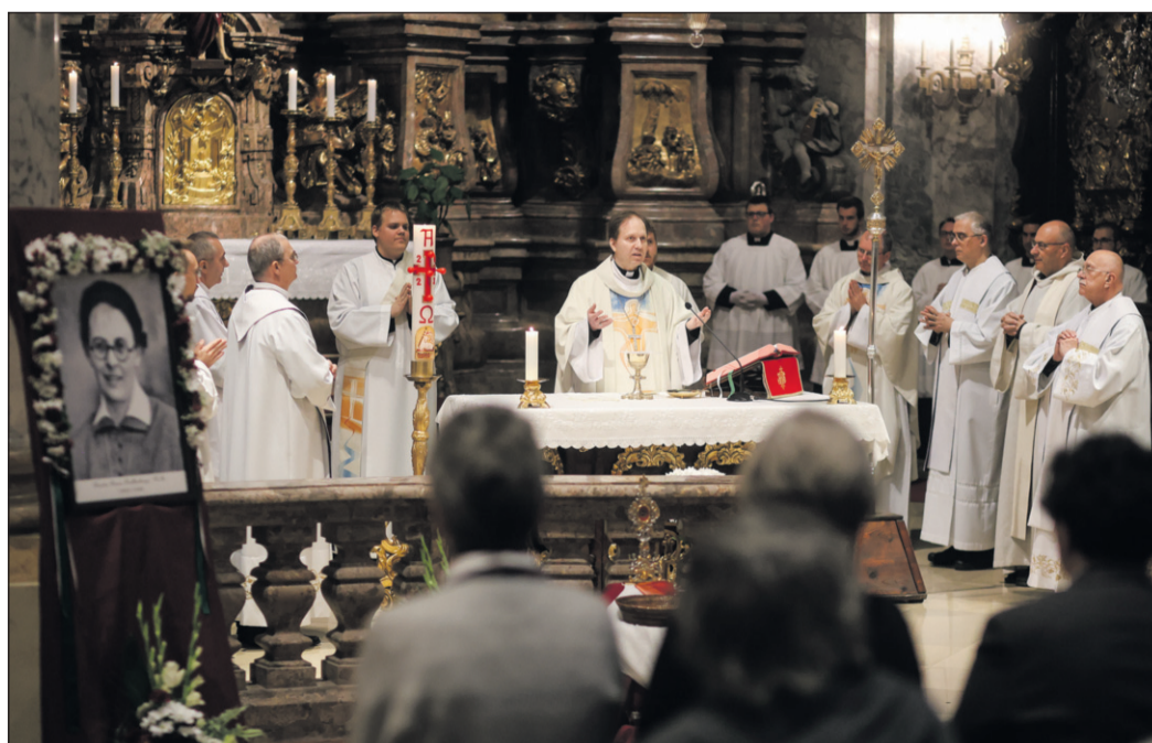
Az Egyetemi templom volt az egyik olyan hely, ahol annak idején az illegálisban titokban találkoztak a testvérek a szentmisén, feltűnésmentesen

Zsuffa Tünde, Baranyai Béla