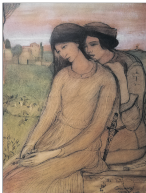
Paolo és Francesca (1903)

mostani kiállítása is kitarulkozás, hiszen a festményeken, ceruzarajzokon kívül fényképek, képeslapok, levelek – például azok, amelyeket Gulácsy az édesanyjához írt – és sok más dokumentum is látható, s mindezek mellett olvashatók irodalmi írásai, meséi is, amelyek mind-mind közelebb visznek a mester lelkivilágának, szellemiségének, emberi vonásainak megismeréséhez. A róla készült, poszterméretűre nagyított, óriási fényképek is ezt a célt szolgálják a kiállítóteremben. Egy pszichológus számára igazi