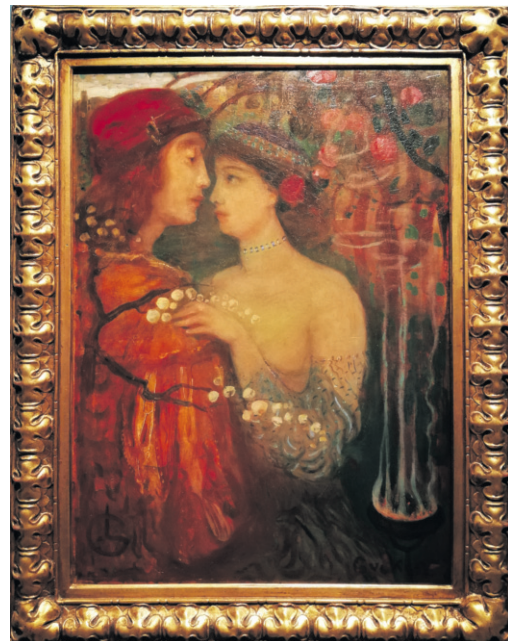
A varázsló kertje (1906-1907)

nézhetjük, és a rajzairól sem maradtunk le. Hiszen ceruzarajzokat is szép számmal készített; olykor ki is színezte őket, pasztellt is használt, amikor a téma úgy kívánta.