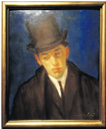
Márffy Ödön portréja Gulácsyról (1907)

Kétségkívül különös ember lehetett Gulácsy, mintha csak a múltban élt volna, afféle szerepjátékosként. Erősen vonzódott a reneszánsz, a barokk és főleg a rokokó hangulatokhoz, öltözékekhez, irodalmi témákhoz. Festészetében a középkori itáliai költő, Dante Alighieri hatása rendkívüli módon jelenik meg. Ezt mutatja a Dante találkozása Beatricével című képe is, amit 1906 körül festett.