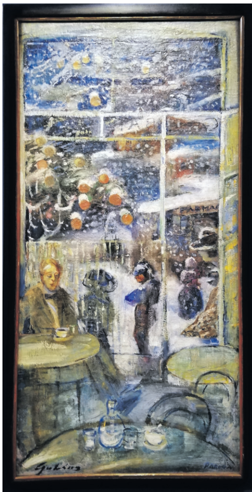
Na'Conxipanban hull a hó (1913)

Gulácsyt azonban nemcsak a reneszánsz, hanem a rokokó is erősen megérintette, olyannyira, hogy életművének nagy részét meghatározta. Ma már kissé nehéz megérteni, mit szerethetett a rokokó öltözékekben, a furcsa pukedlizésben, a rizsporos parókákban. De nem ő volt az egyetlen, aki vonzódott ehhez a korszakhoz. Így volt ezzel Benczúr Gyula vagy éppen Szinyei Merse Pál is, aki már erősen távolodott a historizmustól, lassan araszolva az impresszionizmus felé haladt, képein mégis fellelhető a rokokó iránti rokonszenv. Batthyány Gyula festészetében pedig kifejezetten gyakran érzékelhetjük a stílus jelenlétét. Benczúr XV. Lajos és