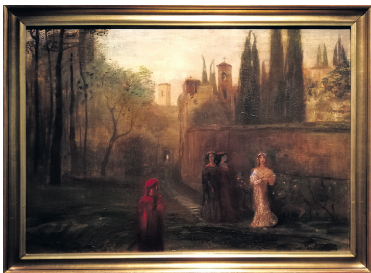
Dante találkozása Beatricével (1906)

igazi előfutárai, sem követői nincsenek. Illik rá, amit Ady írt versében, mintha nemcsak magára, hanem a festőre is gondolt volna: „Sem utódja, sem boldog őse, / Sem rokona, sem ismerőse / Nem vagyok senkinek, / Nem vagyok senkinek. // Vagyok, mint minden ember: fenség, / Észak-fok, titok, idegenség, / Lidérces messze fény, / Lidérces messze fény.”