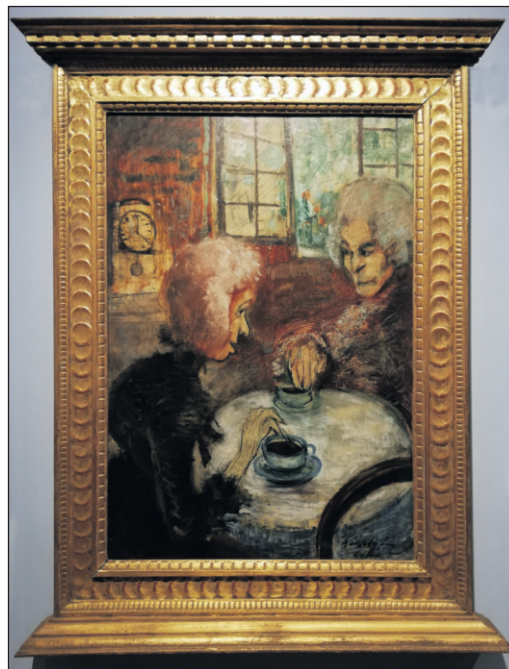
A púpos vénkisasszony régi emlékeit meséli Herbertnek (1911)

Dubarry asszony (1874) című képén szinte tapinthatók a korabeli ruhák, anymek és egyéb drága holmik, annyira anyagszerű, csodás a festői megfogalmazás.