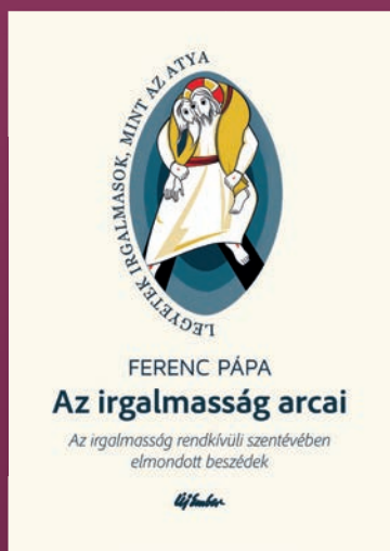
FERENC PÁPA Az irgalmasság arcai