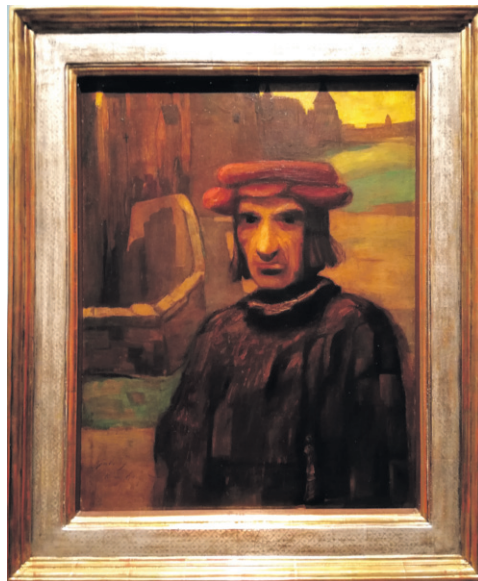
A cselszövő (1904)

A kiállítás rendezői remek munkát végeztek, a mester fellelhető műveinek nagy részét bemutatják a Nemzeti Galéria tárlatán. A fő műveken kívül Gulácsy kevésbé ismert festményeit is meg-