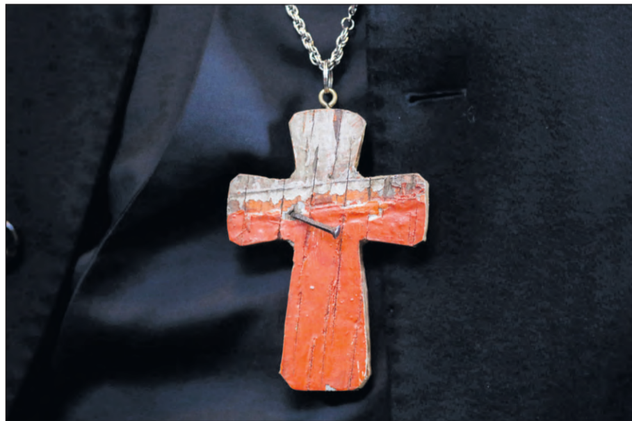
Michael Czerny bíboros mellkeresztje

madt. És mindennek elfogadása után a kereszténység számunkra már tanrendszer és erkölcsi rendszer is, de csak ennek nyomán és ennek erejében az. Jézus korában a zsidók politikai messiást akartak: számukra a kereszt botrány volt. A görögök bölcs szavakat és filozófiai rendszert kerestek: számukra a kereszt nevszerű oktalanság volt. Ma az emberek gyakran könnyen fogyasztható spirituális élményeket akarnak: számukra a kereszt felesleges. Ma a becsületes, jó állampolgárok a helyes erkölcs forrásait, a helyes cselekvésre bíró motivációt keresik: számukra a kereszt legfeljebb csak eszköz. A keresztények azonban egy találkozási keresnek a Názáreti Jézus Krisztussal, aki értünk megtestesült, meghalt és feltámadt. És hogy mindennek mi értelme van? Hogy mi értelme egy ember szenvedésének régi történetét újra és újra elmesélni? Az az értelme, hogy ez a történet messze felette áll minden konvencionális történetnek, amit a valláshoz kapcsolnánk. Ez a legnagyobb szeretet története: az Atya odaadta értünk egyszülött Fiát a keresztben. Ez a kereszt