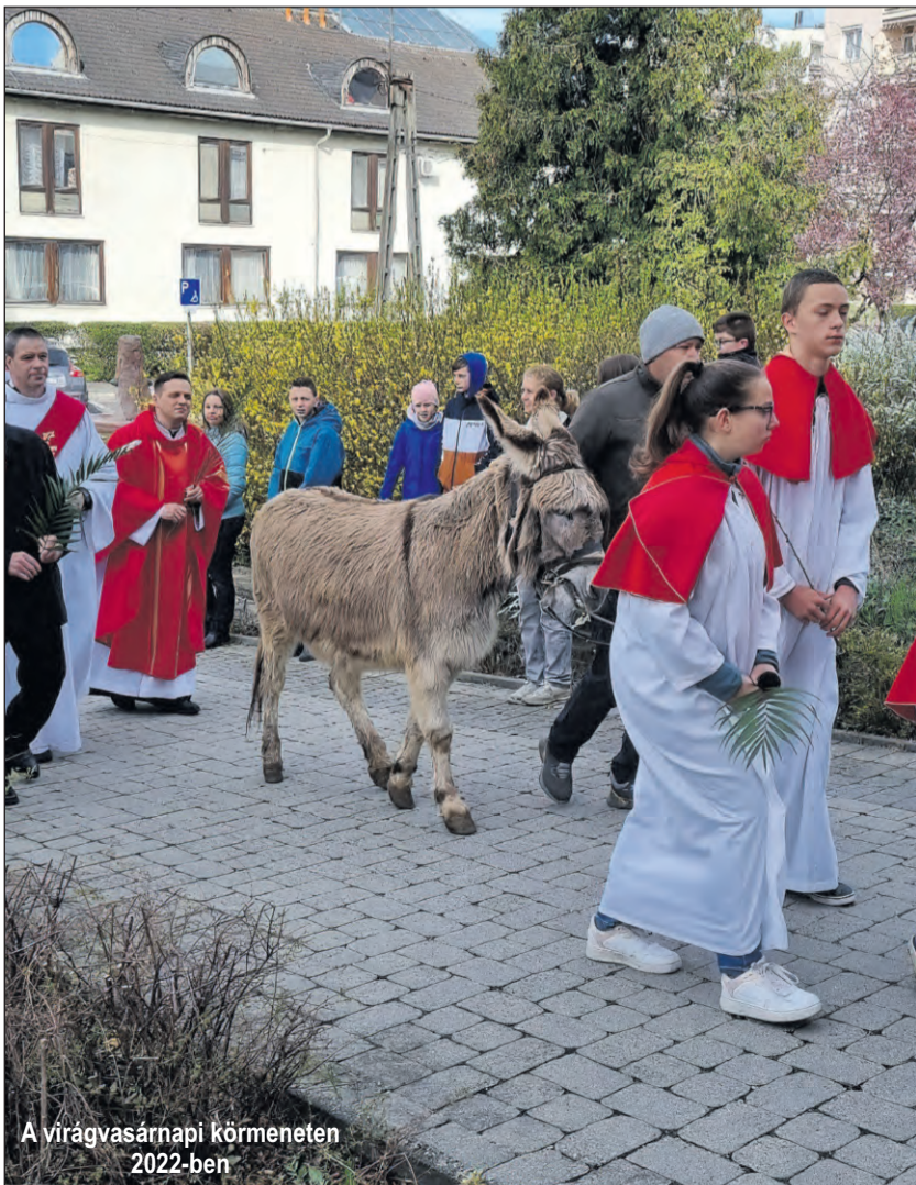
A virágvasárnapi körmeneten 2022-ben

Pallós Tamás