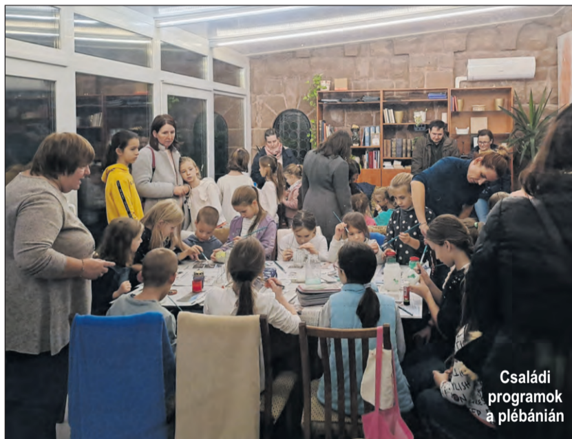
Családi programok a plébánián

– Beszél magáról, múltbéli szerzetesi megpróbáltatásairól?