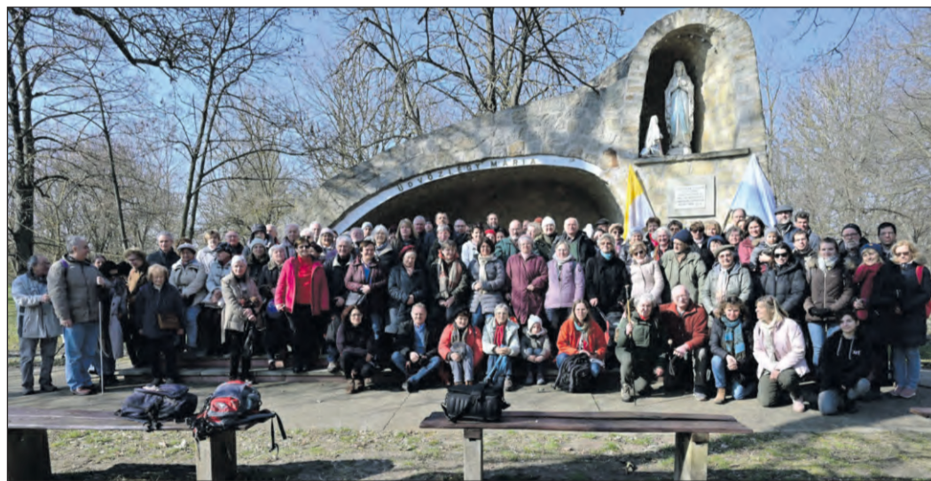
Szentimrevárosi hívók zarándoklata Pálósszentkúton

lem számára megfoghatatlan jelenségek is, amelyek jelenléte nélkül a valóság csak töredékben értelmezhető. Brückner Ákos Előd OCist egykori szentimrevárosi plébános szavaiival szólva ( Lépcső , 2008. október) „felmérhetetlen”, hogy „ebben a világos, derűs, tagölélésű templomtérben hány szorososan tapétázta ki, fűtötte át a falakat a hitvallás, az imádság, a szentségek örök életet építő ereje, a vallásos kultúra, a kiváló és számos vendég lelkesége”.