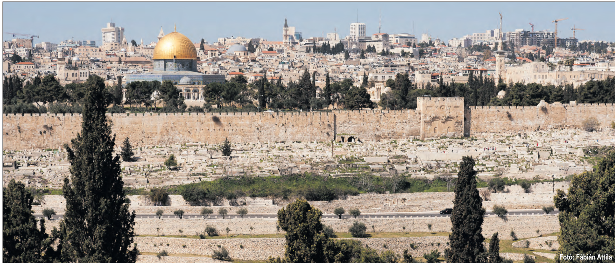
Fotó: Fábán Attila

barlangjába, az oltár alatt ott vannak az alvó apostolok szobrai, s közelükben a kép, a Júdás csókja , és máris hallod szívedben a mélyseges fájdalmat kifejező mondatot az imént még remegve vérrel verejtékező Jézustól: „Júdás, csókkal árusul el az Ember-