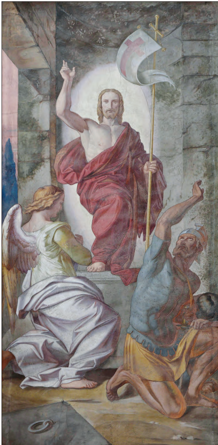
Feltámadt Krisztus Ludwig Moralt freskója (1854 körül) az esztergomi bazilikában

A hit jelei még inkább fontosak és éltető számunkra. János „látott és hitt” (Jn 20,8). Ő volt a szeretett tanítvány, aki a legközelebb állt Jézushoz. Látta Jézust meghalni, s amikor felfedezte a sírban a jeleket, megszületett benne a hit, kialakult a Jézus Krisztushoz fűződő kapcsolat mélysége. Péter is bement a sírba,