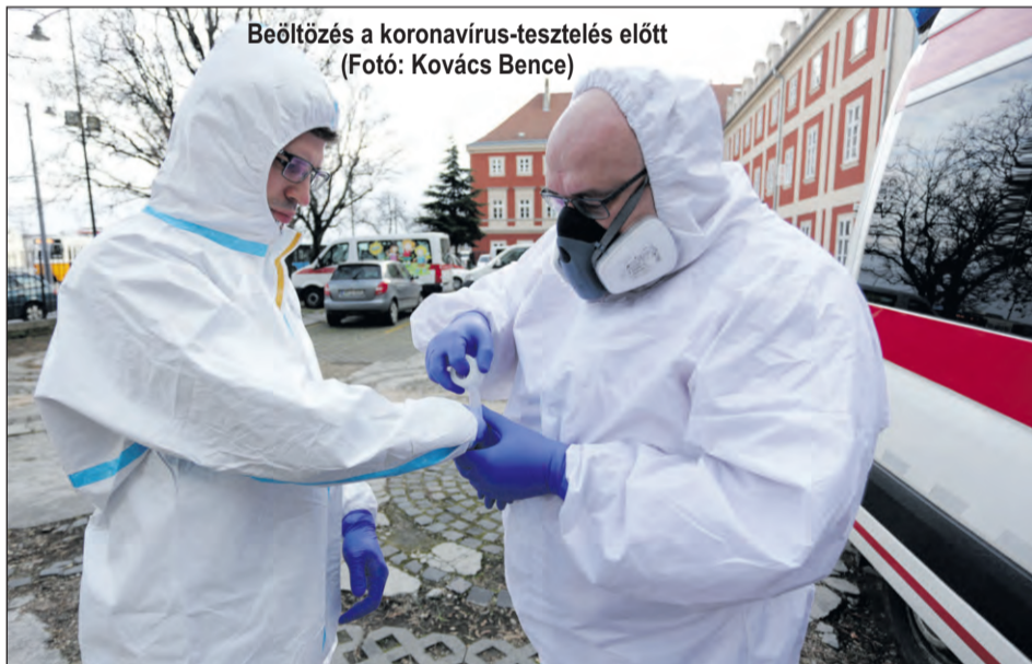
Beöltözés a koronavírus-tesztelés előtt

az emelt szintű elsősegélynyújtó tanfolyamot, ami egyben oktatói képzés is volt. Ezután mondta az egyik barátom, aki szociális munkásként dolgozott a Máltai Szeretetszolgálatnál, hogy mentőápolói tanfolyam indul náluk. Kapva kaptam az alkalmon, és a képzés alatt teljesen beszippantott ez a milió. Valahonnan innen datálható a vészhelyzetkezeléshez való közel kerülésem. Egy másik szervezetenél önkénteskedtem, amikor 2010-ben Felsőzsolcánál áradt a Tisza, és a szakmai vezetőnk, aki egyébként háziorvos, szólott, hogy szükség lenne ott egészségügyi segítségre. Akkoriban főállásban angol nyelvet tanítottam. Úgy terveztem, hogy egy hétvégére megyek le, de végül – a tanulócsoporthoz átszervezésével – jóval tovább tudtam maradni, csak úgy három hét, egy hónap után jöttem haza.