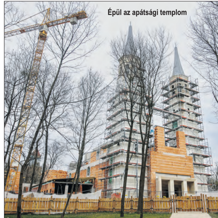
Épül az apátság templom