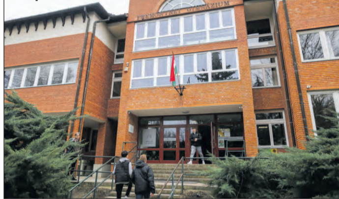
Figyelmet fordítanak az érzelmi intelligencia fejlesztésére is