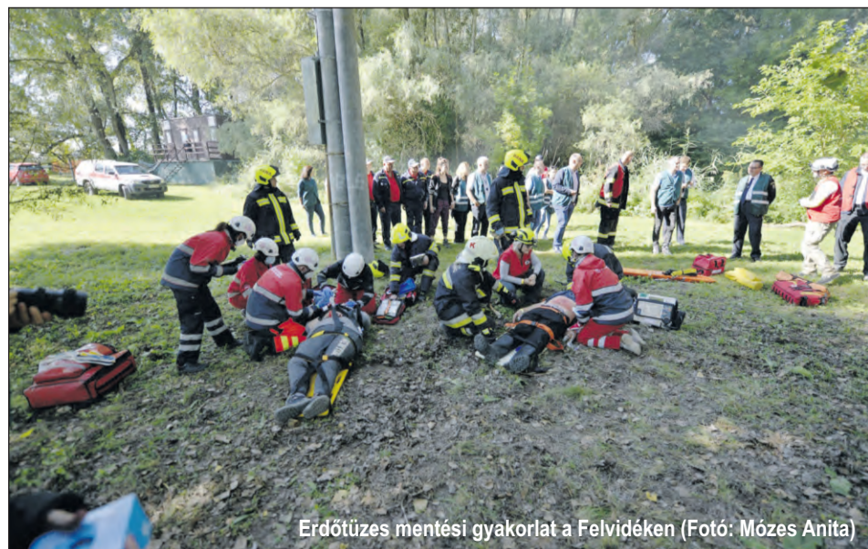
Erdőtüzes mentési gyakorlat a Felvidéken

Aztán 2021 kora őszen – még mindig a járványos időben – végre sor kerülhetett az első szimulációs gyakorlatunkra, ami egyúttal a vizsgánk is volt. A Duna felvidéki oldalán modelleztünk egy erdőtüzes helyzetet tűzoltók és a Vöröskereszt képzett imitátorai segítségével. Egy kis csapat tagjaként befogadóhelyet kellett üzemeltetnem az egyik község művelődési házában. Mivel nem voltunk elég határozottak, egy-két felbőszült károsult nem bírta kivárni a sorát, ránk törték az ajtót. Egy férjétől