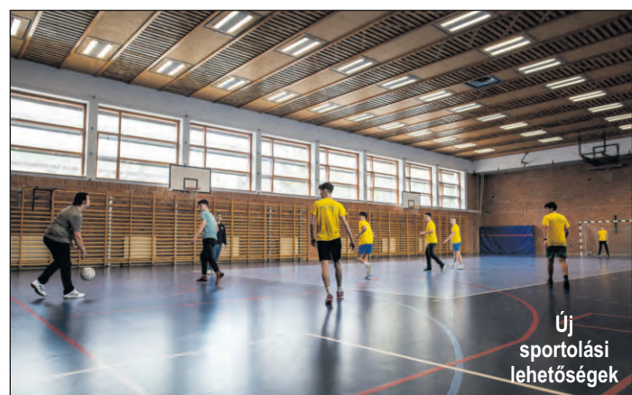
Új sportolási lehetőségek