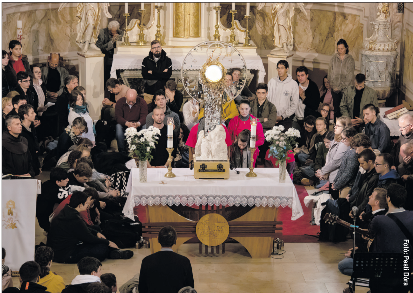
Fotó: Pesti Dóra