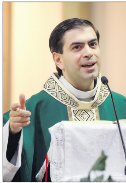
(Folytatás az 1. oldalról)

Isten szeretete öröktől fogva kering és árad a Szentháromság személyei között, kiáradt ránk a teremtésben, és most is – fejtette ki a szónok. Ez az áradás természetes, nem kell kérni, sem méltóvá válni rá, olyan, mint a napfény és a víz. Ám a ránk áradó isteni szeretetet nem mindenki és még csak nem is minden keresztény ismeri. Kétezer évvel a megtestesülés után még mindig küzdünk a szeretet igazságával: nem tartjuk igazságosnak, hogy aki vallásosabb, nem kap többet az isteni szeretetből. Lázadunk ez ellen, holott az isteni szeretet természetes, magától értetődő és ingyenes. Lisieux-i Szent Teréz tanítása egyértelműen kimondja: Isten a semmiért szeret bennünket. Az, hogy ez ma is meglep minket, jelzi, hogy a kereszténységnek még nehézségei vannak az isteni szeretet befogadásával.