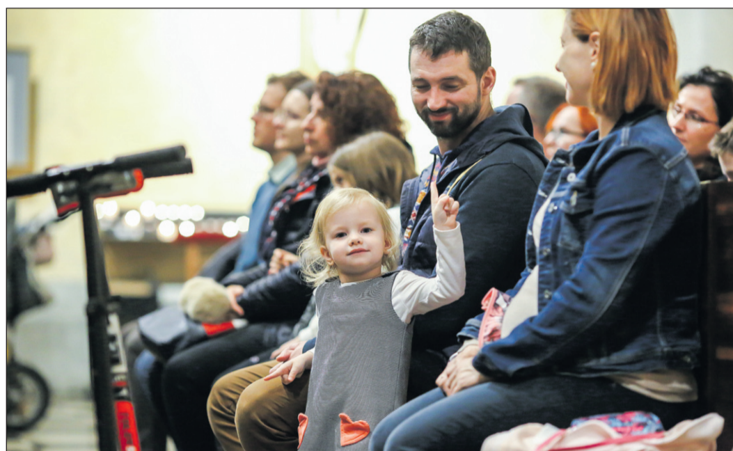
Mise a családokkal, családokért – Otthon lehettünk a templomban