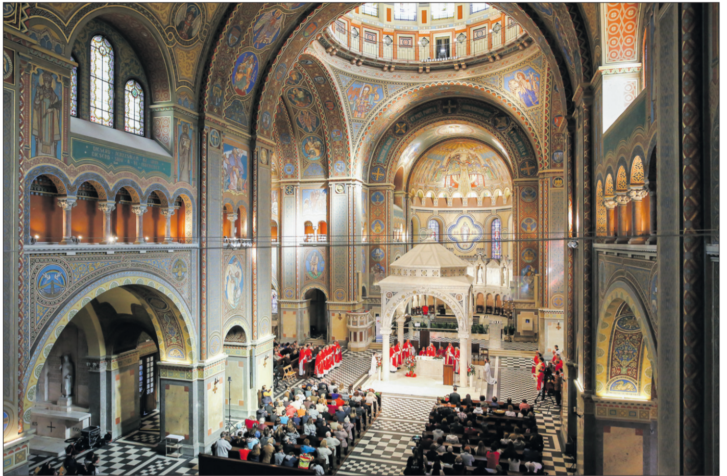
A hit fényénél kell közösen, párbeszédben átgondolni világunk időszerű problémáit