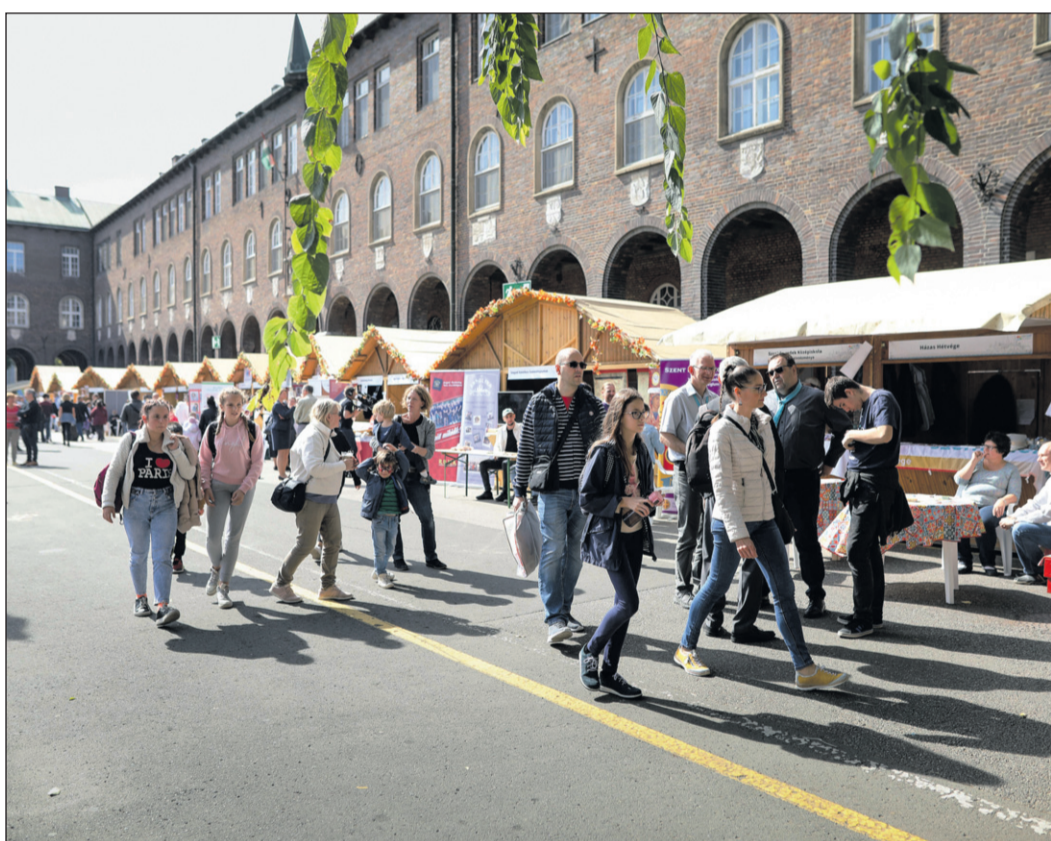
Nem csak a templomban vagyunk katolikusok

dó Szent Gellért Találkozó miséjén a vértanú szentet állította a középpontba: Gellért élete Isten akaratának elfogadásáról szólt, azt a feladatot végezte, amire Isten hívta. Bár idegenbe szólította a szolgálat, és talán a nyelvünket sem beszélte, itthon tudta érezni magát Magyarországon. Így szeretet és béke élt a szívében, és ezt közvetítette az emberek felé is. Példája megerősít bennünket abban, hogy ha elfogadjuk Isten akaratát, ő segít minket abban, amire szánt bennünket.