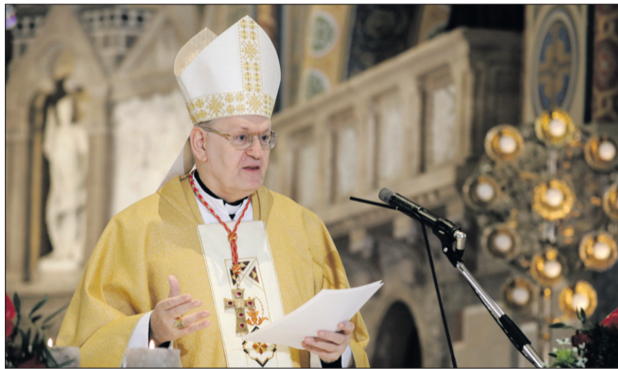
Erdő Péter: Ha átérezzük Isten előtt szegénységünket, tudunk igazán Krisztusra figyelni