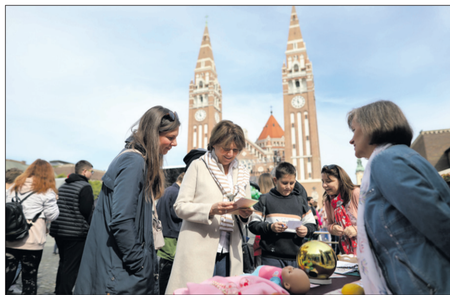
Forgatag a Dóm téren