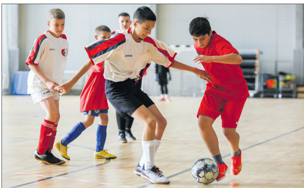
Nagy volt a küzdelem a KATTÁRS-kupáért a Szent Gellért Fórumban