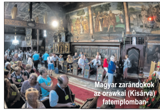
Magyar zarándokok az orawkai (Kisárva) fatemplomban