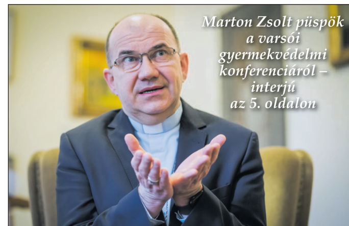
Marton Zsolt püspök a varsói gyermekvédelmi konferenciáról – interjú az 5. oldalon