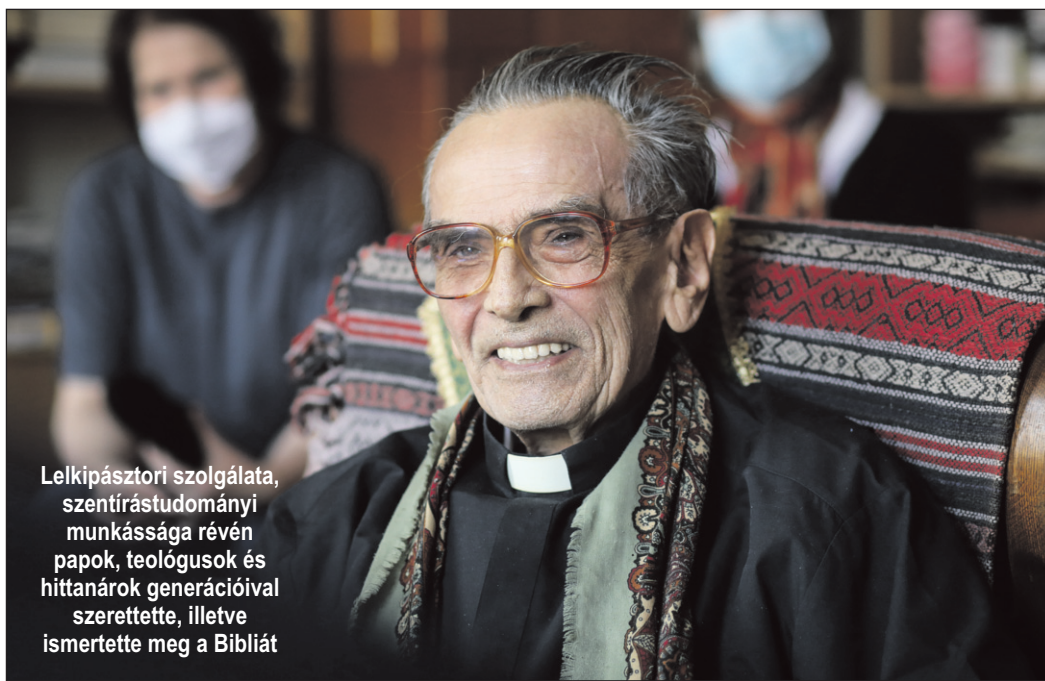
Lelkipásztori szolgálata, szentírásstudományi munkássága révén papok, teológusok és hittanárok generációival szerette, illetve ismertette meg a Bibliát

1997-től évente kétszer szervezte meg és vezette a magyar biblikus tanárok szakmai értekezletét a Bibliaközpontban. 2008-ban, a Biblia évében az MKPK megbízásából a katolikus programok koordinátoraként közreműködött programok ajánlásával, az Esztergomi Nemzetközi Biblikus Szimpózium megszervezésével, a Biblia éve internetes portáljának szerkesztésével.