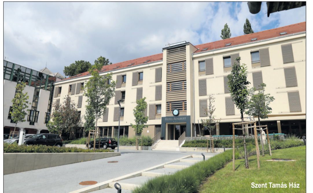
Szent Tamás Ház

Milyen típusú rendezvényeknek adnak otthont?